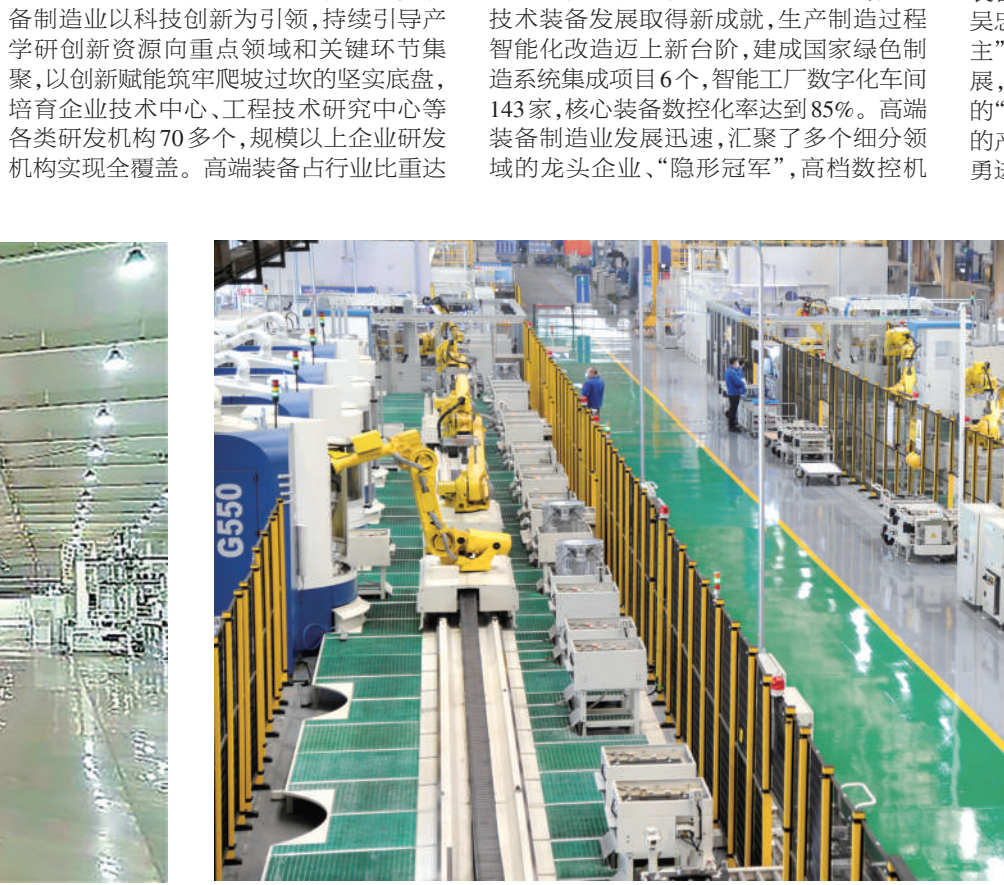
巨能机器人数字化车间。

装备制造产业是宁夏智能制造的重点领域,产品具有技术含量和智能化水平高,精细化、特色化新产品多等特点。经过多年发展,形成了以矿山机械、清洁能源装备、仪器仪表、铸件铸造、数控机床、电气等为主的产业体系。近年来,自治区党委、政府持续优化营商环境,密集出台一系列政策文件及配套措施,推动先进装备制造高质量发展、绿色化、智能化发展取得新成效,多个细分领域实现从“跟跑”“并跑”到“领跑”的跨越,连续多年保持两位数以上增速,一个千亿级装备制造产业集群正加速崛起。 创新驱动激活强劲发展动能。宁夏装备制造以科技创新为引领,持续引导产学研创新资源向重点领域和关键环节集聚,以创新赋能突破攻坚的坚实基础,培育企业技术中心、工程技术研究中心等各类研发机构70多个,规模以上企业研发投入实现全覆盖。高端装备占行业比重达