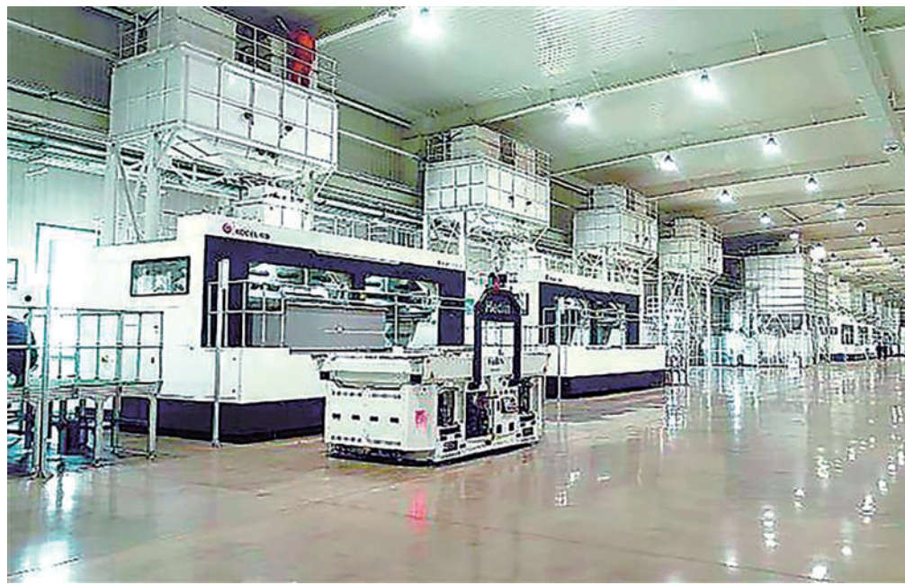
共享集团建成世界首个万吨级铸造3D打印智能制造工厂。