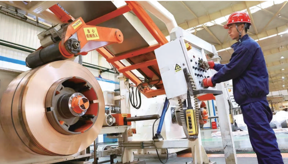
中色东方钨钼稀有金属材料产量位居世界前三。