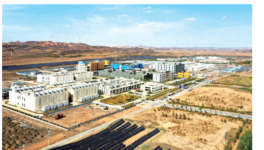
西部云基地数据中心集群。