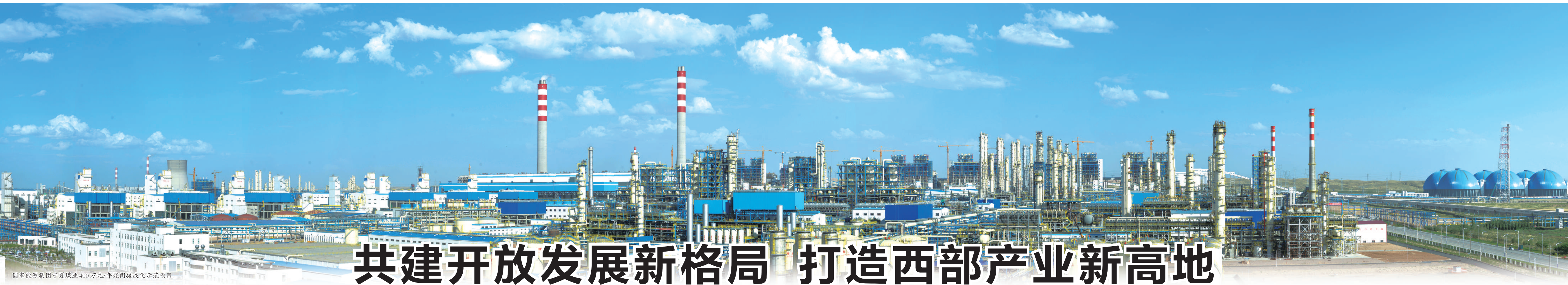
国家能源集团宁夏煤业400万吨/年煤间接液化示范项目。