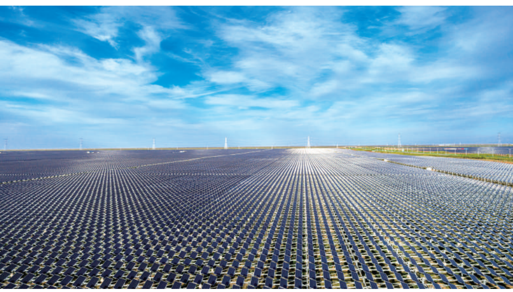
宁夏新能源装机突破3700万千瓦,是全国单位国土面积新能源开发强度最大的省区。

自治区第十三次党代会作出“大力发展煤化工、石油化工、电石深加工等现代化工产业,推动化工产业向规模化方向发展”的安排部署。截至2023年底,全区共有规模以上现代化工企业207家,全年实现工业产值超过1900亿元,占全区规模以上工业比重近30%。现代化工产业是宁夏重点产业中产值规模最大、产业链最长、就业人数最多、税收贡献最高的行业,呈现出特色产业快速发展、特色产品不断涌现、创新活力不断增强、绿色发展快速推进、集群效应不断提升的发展特点。已形成煤制油、煤制烯烃、高性能纤维三大产业集群,煤制油产量连续3年超过400万吨;煤制烯烃产能达470万吨,居全国第3位;芳纶产能达到1万吨,居全国第1位。 现代煤化工快速发展。作为全区现代化工产业的支柱产业,依托国能宁煤、宝丰能源等重点企业,现已形成煤制油产能400万吨、煤制烯烃产能达420万吨,集群效应不断显现。国能宁煤煤制油及