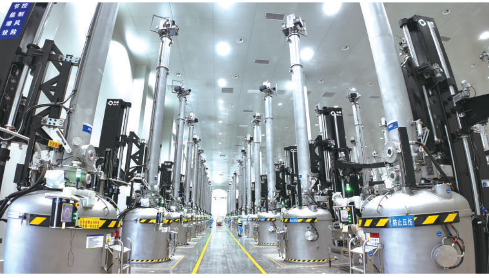
宁夏协鑫拉晶车间。