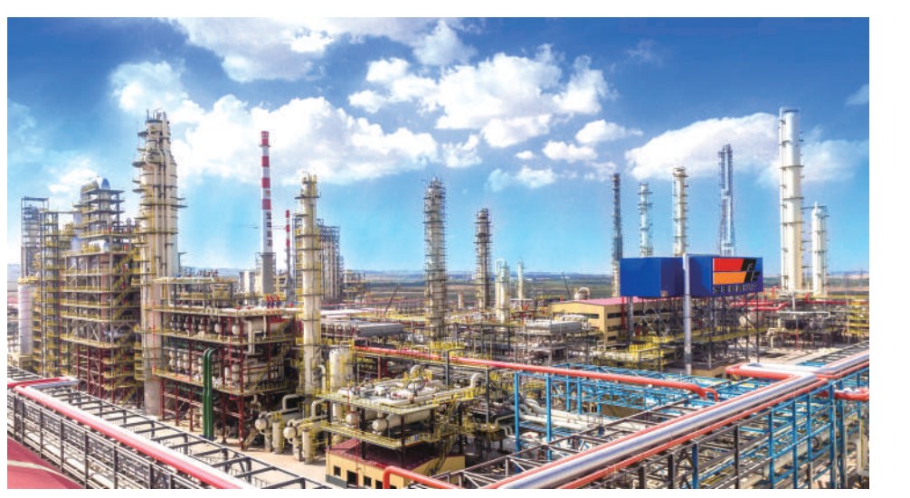
宝丰能源高端煤基新材料循环经济产业基地。

近年来,宁夏把数字经济作为高质量发展的第一增长极,采取非常举措、支持非常产业,实现非常发展,是西部唯一的国家算力网络枢纽和新型互联网交换“双中心”,国家“东数西算”战略基地,国家首个“互联网+健康医疗、教育”等示范区,努力跑出数字经济发展的“加速度”。 宁夏是光纤网络覆盖全国的最优路径选择,绿色能源富集,电力供给充足,气候环境适宜,是国家认定的最适宜建设数据中心的一类地区,建成了全国首批“万卡级”算力基地,算力能力全国领先;建成在建大型、超大型数据中心21座,搭建算力调度平台和网络直连链路,成为全国“东数西算”重要保障基地。宁夏算力质效指数排名全国第四,算力资源环境指数位居全国第一,“中国算力之都”正强势崛起。 在算力产业带动下,宁夏数字产业呈现出集聚式、规模化良好发展态势,建成了全国首批人工智能芯片适配基地,为国产芯片提供测试、验证等服务;建成绿色数据中心集群,是全国唯一四大运营商大型数据中心齐聚的省区;招大引强,中国交建、中国能建等一批央企落户宁夏。建成西部首个智能服务产业链,为智慧基地提供硬件保障;引入亚马逊云、天翼云、移动云、沃云、培育黄河云、脚宁云、苏宁云、共享云等品牌,服务全国4000多家企业,形成从芯片、服务器到算力中心、云服务的算力产业全链条。 宁夏加快数字宁夏建设,推动实施“1244+X”行动计划,丰富的应用场景为千行百业插上数字化翅膀。宁夏建成全区智慧教育平台,让城乡学生间上一堂优质课;开通远程教学诊疗中心,让群众在家门口连线全国各地专家;发布了医疗健康、安全生产等应用场景,打造大模型应用场;开放上百个人工智能大模型应用场景,打造大模型策源地,赋能千行百业;累计培育工业互联网应用示范项目近200个,工业数字化研发设计工具普及率达61%,关键工序数控化率达62%,位居西部第二。 宁夏围绕数字产业化和产业数字化,重点承接芯片、智能终端、算力中心、人工智能、软件开发、云计算等领域项目,建设服务器制造、“万卡+”智算、智能产业、软件服务“四大基地”,开辟数字经济新赛道,形成人工智能新优势,打造千亿级产业集群。