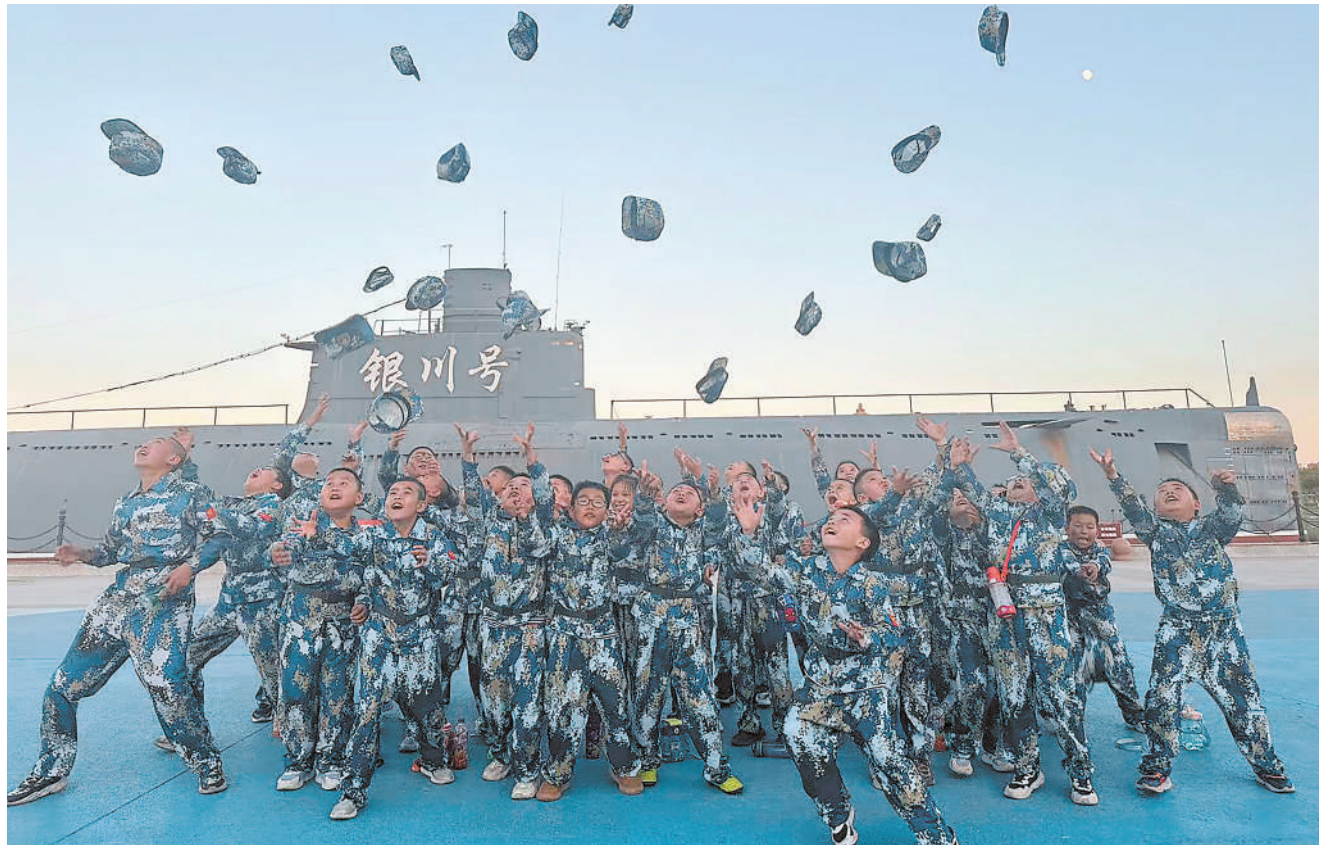
军事夏令营活动中,孩子们开心地合影。

“每个大人都曾是孩子”,每个家长也都经历过有西瓜和冰棒的暑假。在这个充满阳光和鸟鸣的假期里,让孩子们继续拥有欢笑和自由吧!