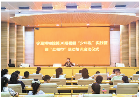
宁夏博物馆暑假“少年说”实践营启动仪式。