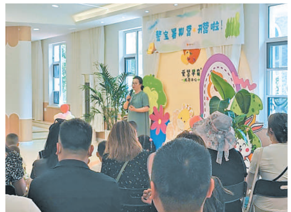
银川市兴庆区分局“警宝”暑假托管班活动现场。

对此,自治区总工会女工部相关负责人表示,将继续关注职工家庭的需求,积极推动相关政策的落实,并鼓励更多有条件的单位开办暑假托管班,为职工解决实际困难,让他们能够更安心地投入工作,同时也为孩子们成长提供更多的关爱和陪伴。