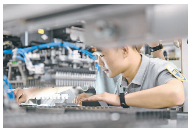
宁夏小牛自动化设备股份有限公司生产车间,工作人员正在精准操作。

2023年,银川市累计为企业减免各类税费127.6亿元,降低企业社保费24.75亿元,新增贷款529.53亿元,兑现各类奖励补贴资金12.17亿元,“真金白银”助企纾困前行,真心实意提振发展信心。