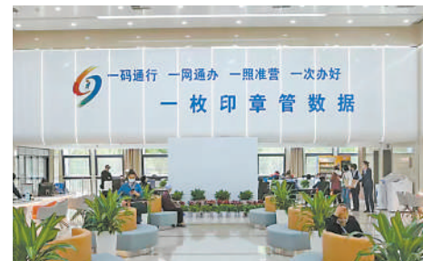
一网通办,简洁高效。

今天的银川,正处在加快建设黄河流域生态保护和高质量发展先行区示范市、铸牢中华民族共同体意识示范市的磅礴浪潮中,经济发展活力四射,合作共赢魅力无限;今天的银川,正加快优化提升营商环境,全社会尊重企业家、爱护企业家、服务企业家的氛围日益浓厚,创新创业正当其时,投资发展恰逢其势。银川市热忱希望与企业家一道,以机会清单为媒,深度链接城市发展需求和企业发展需求,同心奋进、扬帆快进,共享城市发展机遇,共创幸福美好生活。