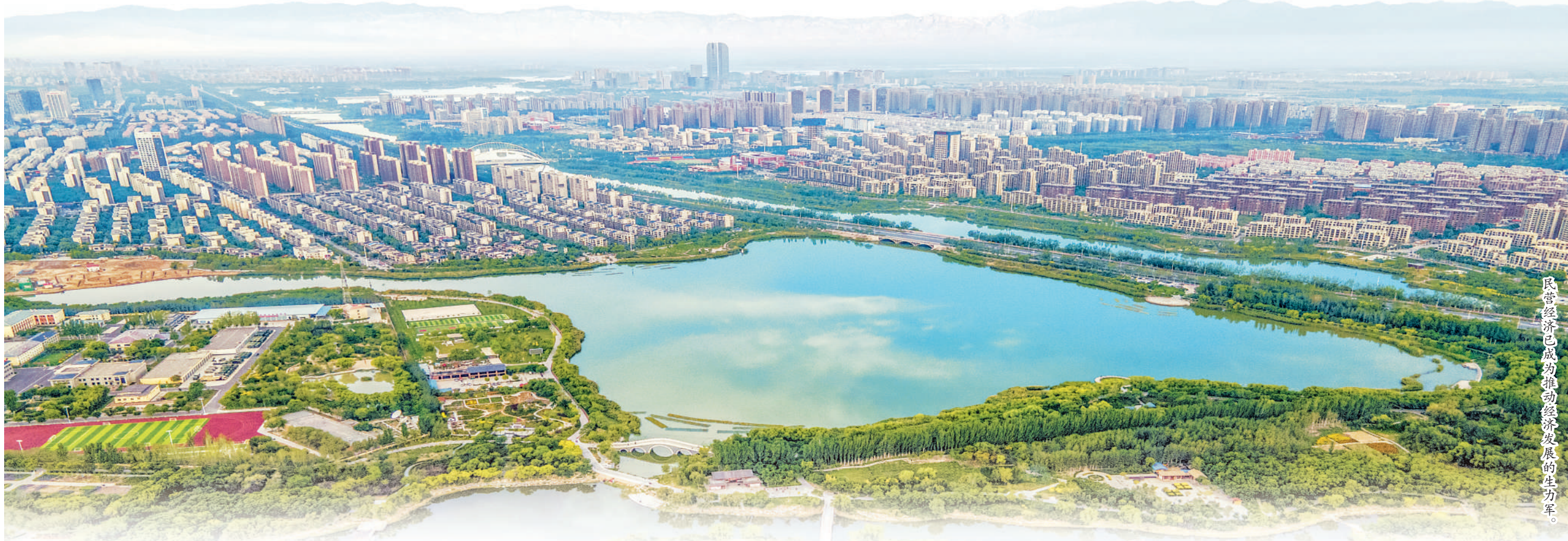
民营经济已成为推动经济发展的生力军。