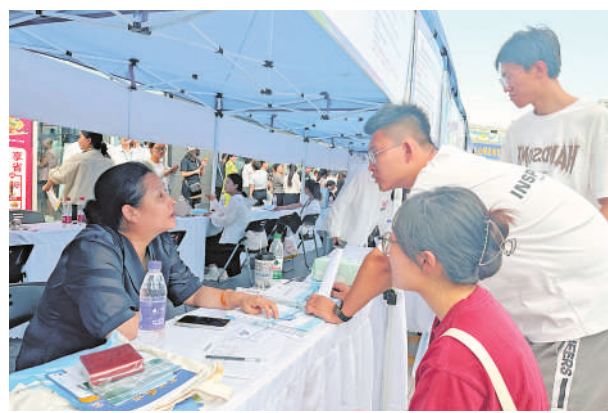
7月19日,在银川市2024年民营经济“百日千万招聘专项行动”专场招聘会上,80家企业提供2457个优质就业岗位。