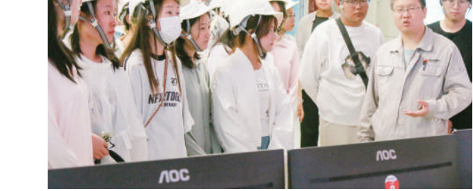
近日,30名灵武籍在校大学生走进国能宁夏灵武发电有限公司。在工作人员的讲解下,学生们了解发电厂运转的基础知识和相应操作流程。灵武市充分利用暑期高校学生返乡契机,为青年人才回乡发展及家乡招才引智牵线搭桥。 本报记者 李宏亮 马赛尔 实习生 黎黎玥 摄

双泉村旧貌换新颜 本报记者 刘文鑫 7月29日,细雨过后,固原市原州区开城镇双泉村被一层薄薄的雾气笼罩,为村庄增添了几分诗意。走进双泉村,大树掩映下的红色砖瓦民宅,错落有致。 2023年,固原市原州区实施开城镇双泉村乡村振兴示范村项目,总投资3800多万元,旨在打造一个看得见山、看得见水、记得住乡愁的生态宜居和美乡村。 经过细心打磨,建设,双泉村河道治理成了景观,原来不流动的水,现在变成了活水,自行车道和步行栈道,为游客提供了休闲健身的场所。依托古树古泉建设的广场,将山水树木巧妙结合起来,成为人们休闲锻炼的好去处。 “家门口是新建的广场,古树古泉都被完整保存下来,一切都得到了延续。”75岁的村民王少槐,看在眼里,喜在心头。随着村容村貌提升、宜居农房建设、古泉风情街、休闲露营地等工程实施,双泉村以崭新的面貌展现在人们眼前。 然而,昔日的双泉村却是另一副模样。曹晓娟,这位从内蒙古赤峰市嫁到双泉村的媳妇,已经在这里居住了12年。她回忆起刚到双泉村时的情景:“雨雪天,土路成了泥路,人都不愿出门。有时在城里办事太晚回村,出租车都找不到村在哪里。”“变化来得太快了!”曹晓娟做梦都想不到,曾名不见经传的小村庄有脱胎换骨的一天。她清晰记得,变化是从2016年开始的,进出村唯一的泥土路被修建成了柏油路。 “到了2021年,道路进一步拓宽,建成两车道。村里的环境得到改善,垃圾得到及时清理,河水变得更加清澈。”村民张栓安说,基础设施日益完善,人们生产生活环境大变样,大家陆续从城里返回,发展养殖和种植产业。 “乡村振兴示范村建设以来,村民在本地找到了活,不用再外出打工了。”双泉村党支部书记王进才感慨地说,村里的人气一下旺了起来。 现在,张栓安在家养殖肉牛、中蜂之余,凭借水电工一技之长,在工地找到了一份工作,实现在家门口就业。在城里跑出租车的54岁村民刘来虎,如今回到村里驾驶旅游车,带着游客观光。 现在的双泉村,小桥、流水、人家、老树、青山……优美的生态环境与丰富的文旅资源、秀丽的田园风光交相辉映,构成了一幅动人画卷。