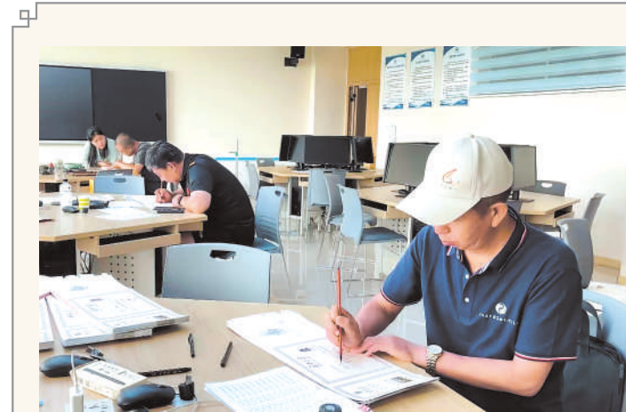
宁夏大学教师们认真书写新生录取通知书。