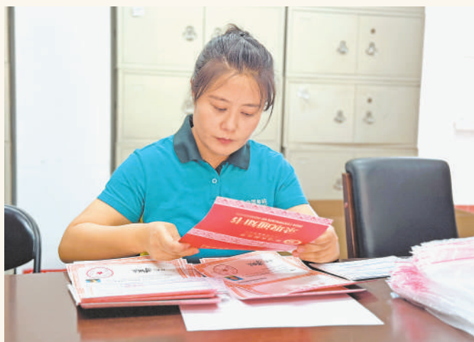
工作人员在北方民族大学招生办公室核对录取通知书。