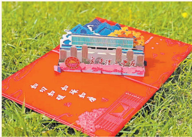
宁夏理工学院2024级首届研究生录取通知书。