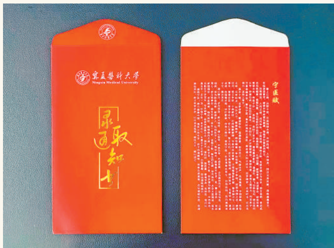
宁夏医科大学2024年录取通知书陆续开始邮寄。这份“入学礼”设计出自在校学生之手。