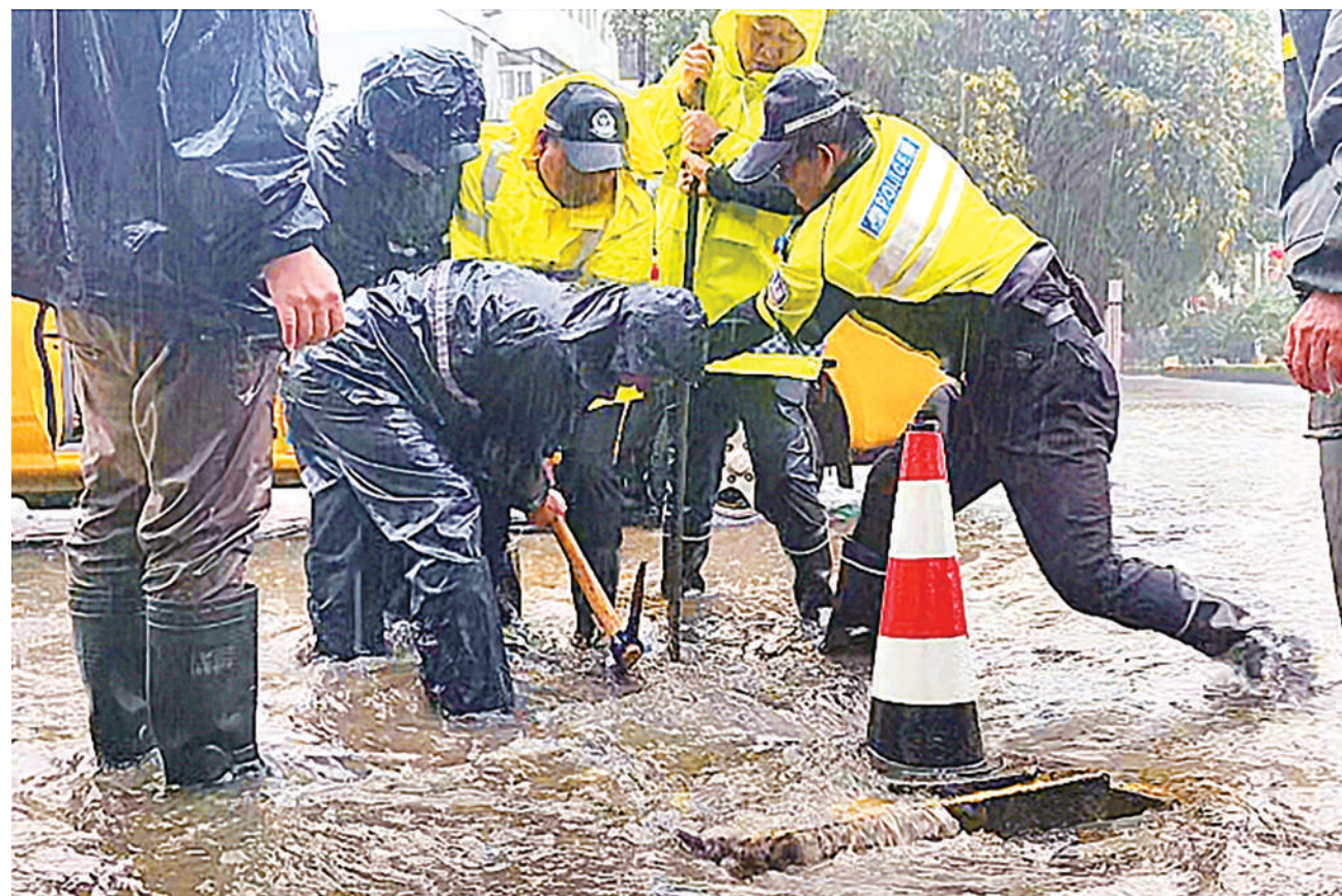
8月8日,石嘴山市公安局交通警察分局民警联合有关部门冒雨排涝。当日,宁夏多地出现超强降雨,各地、各有关部门闻汛而动,第一时间开展应急处置工作,全力保障人民群众生命财产安全。

谁盛美酒醉四方 宁夏书写“好酒源自好风土”的传奇 本报记者 王婧雅 放眼望去,贺兰山下,60万余亩酿酒葡萄种植基地纵贯南北,261家葡萄酒酒庄与酿酒葡萄种植企业茁壮成长……宁夏贺兰山东麓葡萄酒产区,凭借得天独厚的自然条件,已成长为中国乃至全球葡萄酒产业的新星。好酒源自好风土。从区域成长到国内立足,再到绽放世界舞台,宁夏以高起点规划、高标准推进,向世界展示贺兰山东麓葡萄酒产业高质量发展成果。 (一) “谁能想到,这片充满生机的土地,16年前还是荒废的采砂场。”夏日,贺兰山下游客如织,志辉源酒庄总经理袁园向游客介绍,走生态优先、绿色发展的道路,才是葡萄酒产业的未来。驱车游览,贺兰山下,昔日风沙漫天的景象已不复存在,取而代之的是古色古香的休憩亭、整齐的行道树与防风林。这里,绿水青山正转化为金山银山,葡萄酒项目加速推进,产业集聚效应显著。张骞葡萄酒项目作为自治区级重点项目,已完成多项生态修复与建设工程,预计将于8月底完成土建及设备采购招投标工作。 明长城脚下,鸽子山葡萄酒文化旅游小镇建设再传佳音:今年截至目前,青铜峡葡萄酒产区共建设王朝天夏、华东、银票、西班牙、辰申5家酒庄,总投资超2亿元,同时落实多项酿酒葡萄基地的建设与改造项目。目前,鸽子山产区庙湖湖周边的绿化与生态修复项目已全部完成。 在推进葡萄酒产业发展的同时,从顶层设计到步步实践,宁夏始终坚守生态底线,坚持“生态优先、绿色发展”的理念。贺兰山东麓酒庄充分利用山荒地资源种植酿酒葡萄,将38万亩荒地转变为绿洲,有效遏制了水土流失,构建了一道绿色生态屏障。 截至2023年,宁夏酿酒葡萄种植地开发面积60.2万亩,占全国酿酒葡萄种植面积的近40%,是我国最大的酿酒葡萄集中连片产区。“贺兰山东麓葡萄酒”品牌价值330.07亿元,位列全国地理标志产品区域品牌第七。 (二) 从名不见经传,产销两难,到如今成为宁夏对话世界、世界认知宁夏的“紫色名片”,贺兰山东麓葡萄酒产区一路走来,写下奋斗的诗篇。(下转第五版)