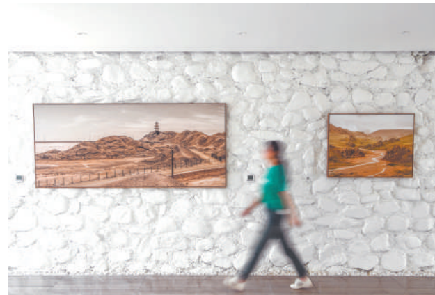
嘉地酒园不定期展出传递贺兰山风土人情的艺术作品。