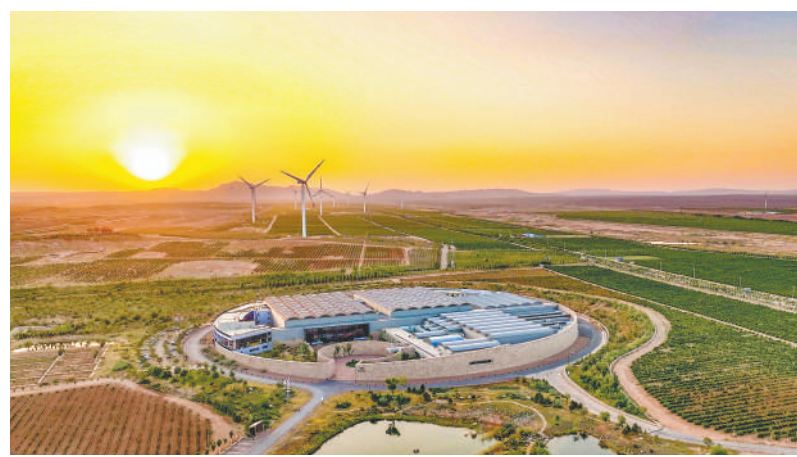
造型外圆内方的西鸽酒庄,体现兼容并蓄的理念。