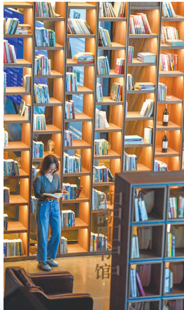
图书馆让西鸽酒庄多了几分书卷气。