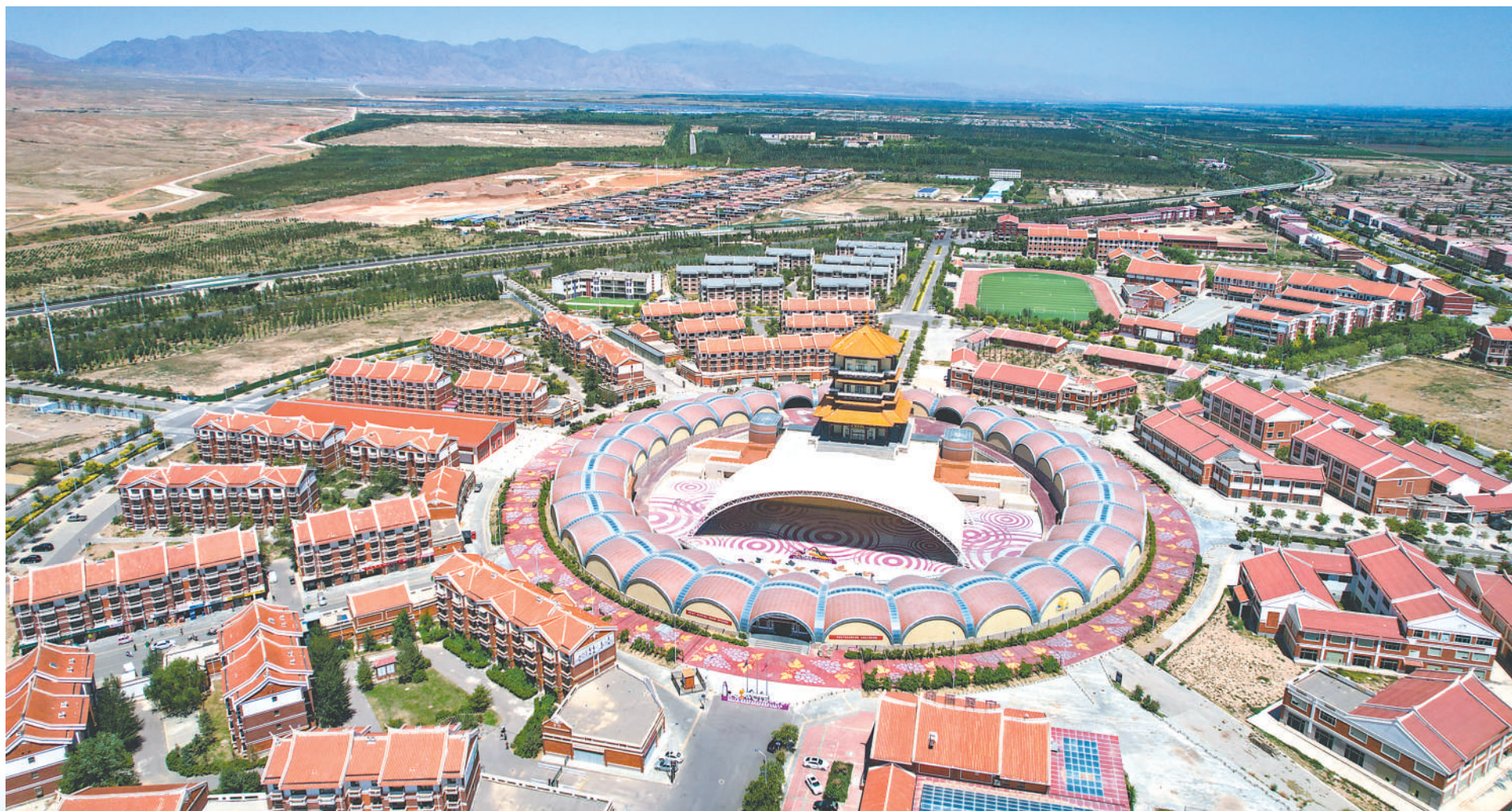
贺兰红酒庄外墙由32个巨型橡木桶围成一圈,充满创意。