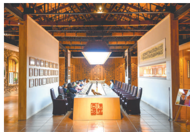
志辉源石酒庄内,游客在电视剧《星星的故乡》取景点打卡、品鉴葡萄酒。