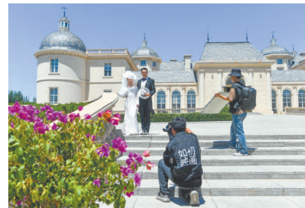
张裕龙谕酒庄成为婚纱摄影热门取景地。