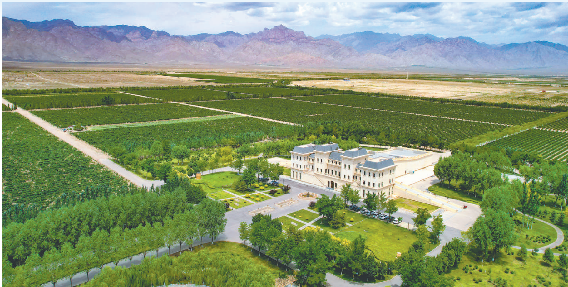
别具一格的美贺酒庄。