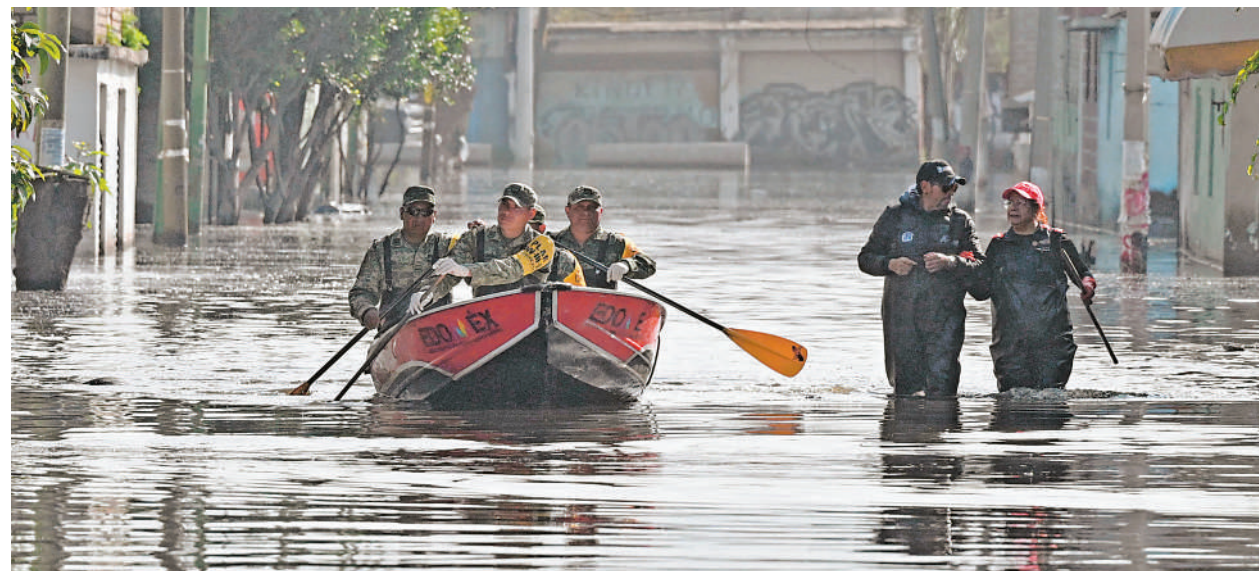
8月21日,在墨西哥中部墨西哥州的巴列-德查尔,军人在一条积水的街道上划船巡逻。受强降雨和排水系统欠佳影响,墨西哥中部墨西哥州的巴列-德查尔科近三周来持续遭遇洪水侵袭。

欧航局说,飞越月球使探测器相对于太阳的速度增加了0.9千米/秒,引导其飞向地球;飞越地球使探测器的速度相对于太阳降低了4.8千米/秒,从而引导其进入新的轨道,飞向金星。与飞越前路径相比,月地飞越使探测器航向偏转了100度。