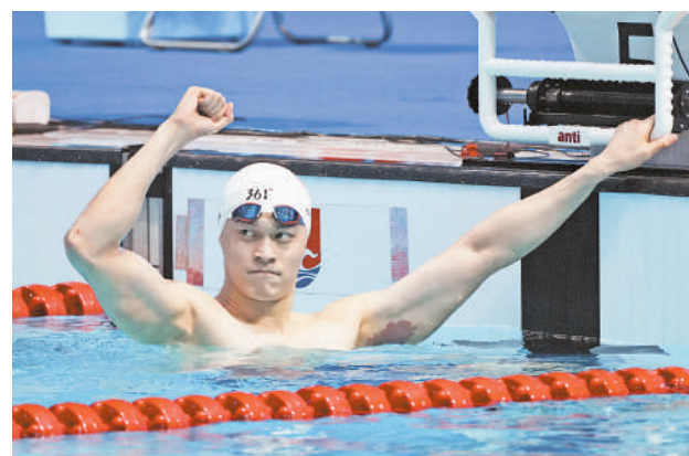
8月25日，孙杨在夺冠后庆祝。

据悉，本次比赛为2024年全国游泳锦标赛(25米)资格赛之一，竞赛项目含14个大项28个小项。全国24个省区市的约500名运动员参赛。与孙杨同池竞技的大多是“00后”“10后”选手。作为比赛中少有的“大龄选手”，孙杨希望小将们未来能为中国男子游泳贡献更多力量。