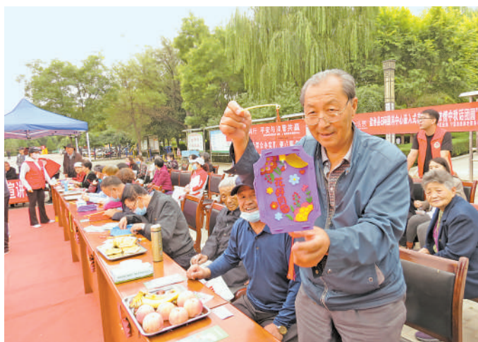
“邻居节”手工制作比赛。