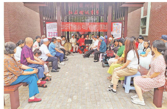
盐池县北关社区举办“民族团结心连心 中华民族一家亲”非遗道情演出。

盐池县充分发挥红色文化培根铸魂作用，深入挖掘整理宁夏工委、盐池县委在麻黄山乡组织、战斗、统战等革命历史，完成宁夏工委纪念馆布展运行，打造李塬畔铸牢中华民族共同体意识实践基地，不断完善“三馆”（李塬畔县委旧址纪念馆、唐平庄宁夏工委旧址纪念馆、五史馆）“三步道”（王到山步道、游击步道、十公里行军步道）实训功能，探索红色教育、廉洁家风、大接杏抚育等特色课程，建成独具特色的“窑洞党校”教育体系。推出“相约红色川塬梁梁”全域红农文旅品牌和“红色山乡情”文创品牌，设计纪念徽章、研学文具等文创产品5类16项，打造“研学宿营”“相遇塬畔”等红农文旅IP，发布3条红色研学路线，让红色历史成为“看得见、记得住、可体验、带得走”的文化符号。今年以来，先后吸引300余批次3万余人接受红色教育洗礼，引导各族群众坚定理想信念，厚植爱国主义情怀，不断夯实共同团结奋斗的思想基础。