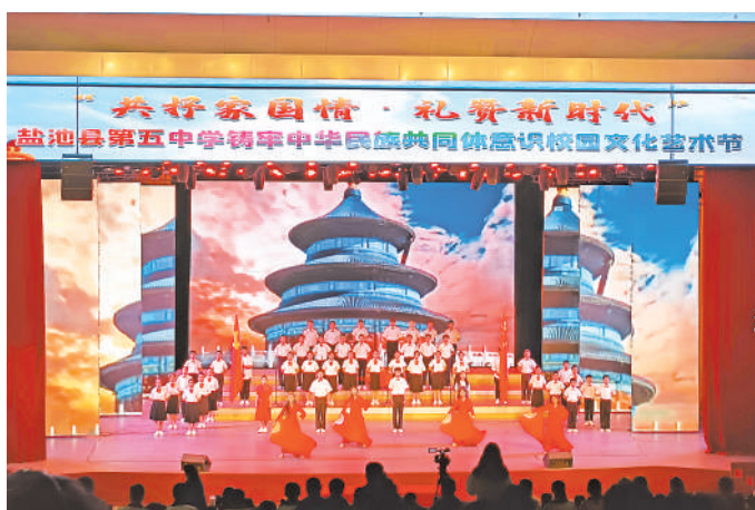
盐池县第五中学举办铸牢中华民族共同体意识校园文化艺术节。