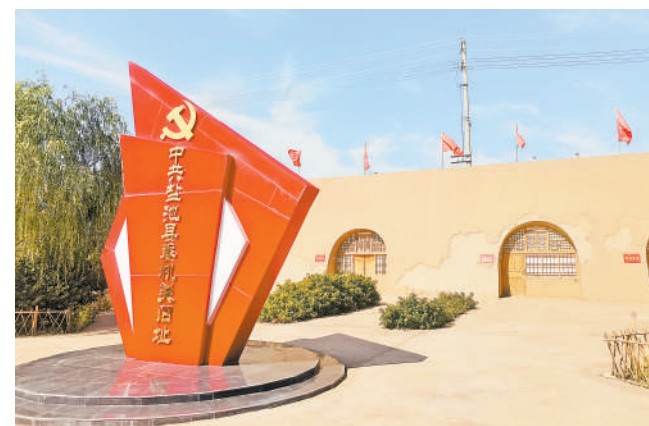
盐池县铸牢中华民族共同体意识实践基地。

“文明实践润民心，学习雷锋树标杆。干群关系心相连，民族团结护稳定。”每个周末，“道情传理论”在盐池县长城关城楼下开演。在白炽灯映照下，白布上的皮影栩栩如生，白布后面的艺人们吹拉弹唱、舞动皮影，现场十分热闹。