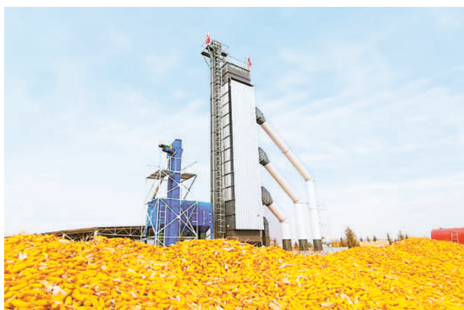
少数民族发展资金项目建设的玉米烘干塔。