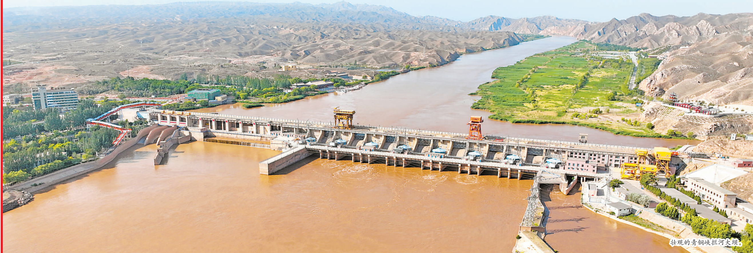
壮观的青铜峡拦河大坝。