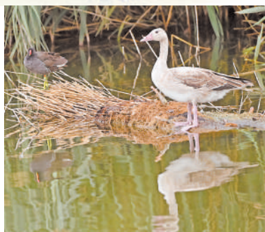
伫立在水边的灰雁。