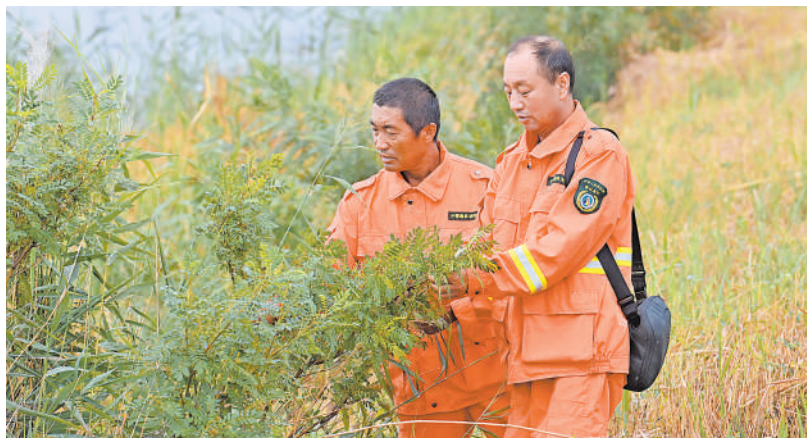
青铜峡库区湿地自然保护区工作人员开展日常巡护工作。