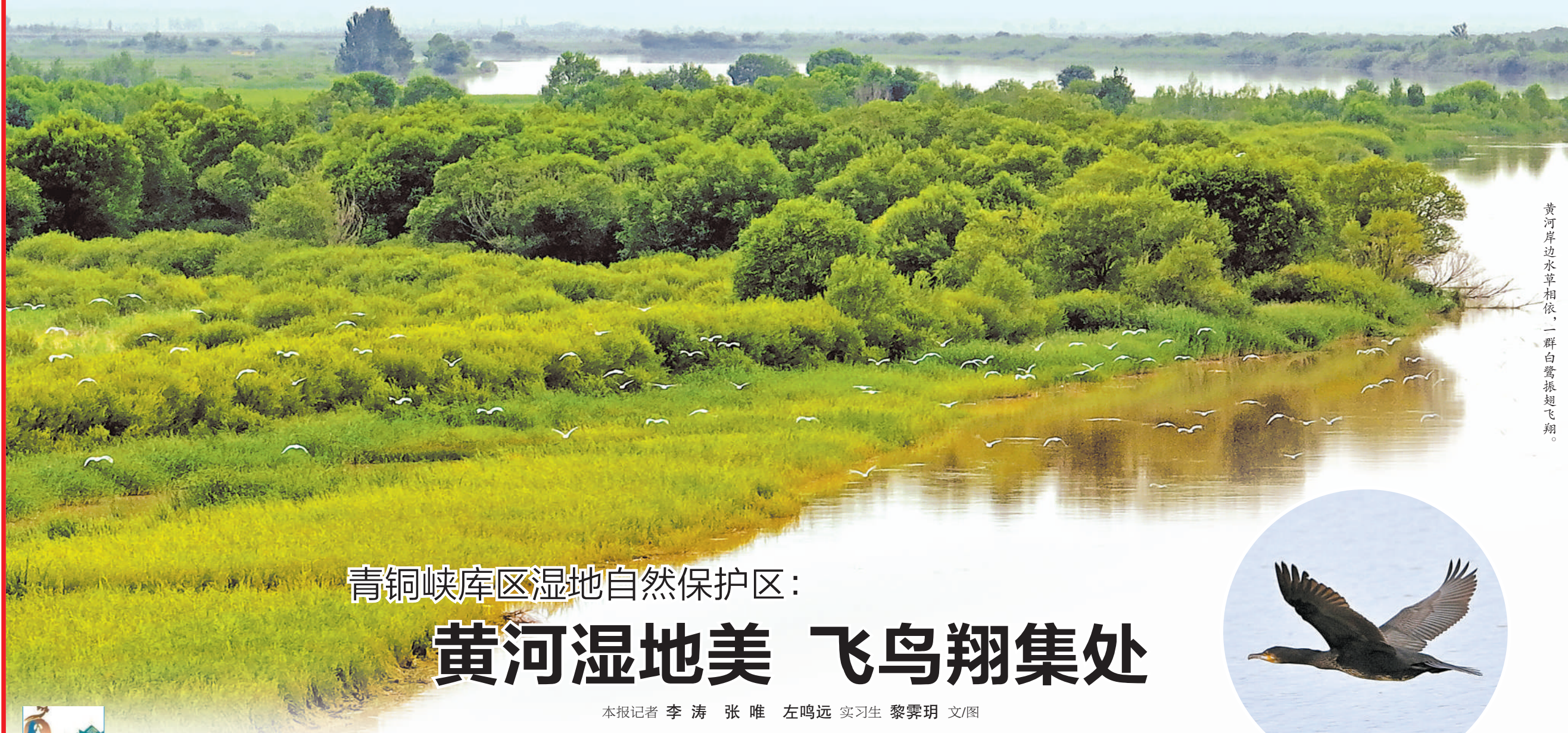
黄河岸边水草相依,一群白鹭振翅飞翔。