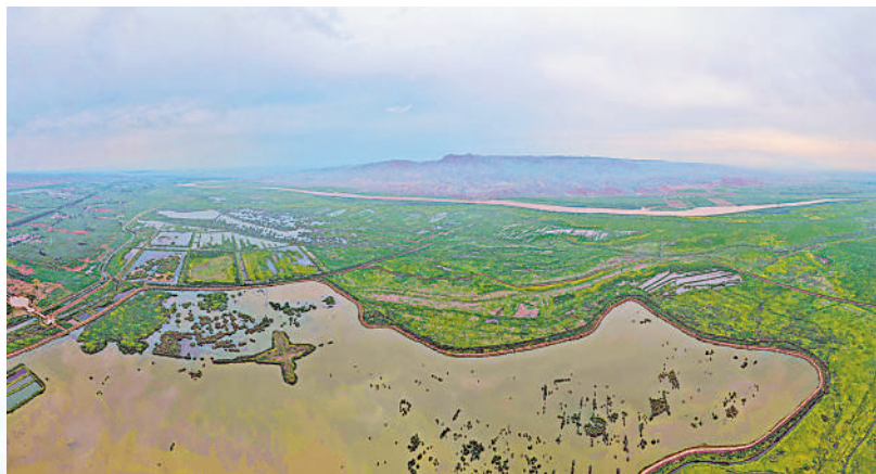
青铜峡库区湿地自然保护区是我区最大的黄河滩涂类型湿地自然保护区。

初秋时节的青铜峡库区湿地自然保护区,水波荡漾,芦苇摇曳、飞鸟翔集,一派醉人风光。