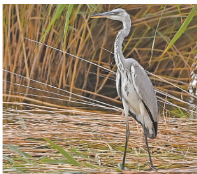
苍鹭在芦苇丛中捕食。