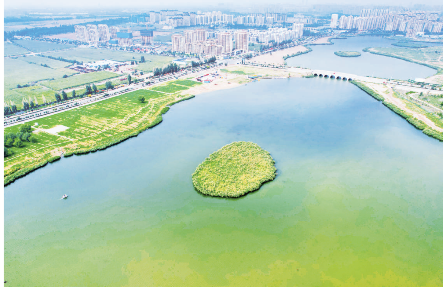
9月7日,俯瞰宁夏银川市银子湖。目前,银子湖水系环境综合整治项目正在建设中,预计2026年3月完成,届时将打造出一个集自然野趣、生态休闲、运动活力、文化体验等于一体的生态公园。

我区「促消费特惠季」直播间发放6000余万元消费券 商家线上线下销售额超7.8亿元 本报讯(记者 杨娟)“直播间也可以领消费券了!”9月6日,在电商直播季促消费特惠季活动直播间,记者体验到领取满100元立减20元电商消费券的惊喜。 “促消费特惠季”是自治区商务厅主办的“我在宁夏带好货”2024直播电商季核心活动之一,采用线上线下双轮驱动模式,历时1个月,5市22个县(区)积极响应,精心策划并组织了16场丰富多样的直播电商促消费活动,不仅涵盖直播带货、电商培训、直播达人赛等多个领域,还紧密结合当地独特文化和资源优势,为消费者带来新颖便捷的购物体验。 抖音、淘宝等头部电商平台发力,以最新业务模式和技术创新助力“促消费特惠季”。海天集团推出食品生鲜百万爆款计划和半托管、全托管新业务模式,带动8月份宁夏生鲜产品在平台销售额迅速增长,其中,生羊肉同比增长20%;京春春晓计划以AI助力1分钟0元开店及新商家2倍流量、5800元流量支持,为新入驻商家降低50%的成本;抖音电商开展牛羊肉产地溯源并推出生鲜行业免佣政策;快手也推出产业带溯源活动。这些活动不仅降低了商家运营成本,也提升了消费者购物体验,为宁夏电商产业数字化转型提供有力支持。 自8月16日“促消费特惠季”活动发放“锦绣宁夏”第一张电商消费券以来,目前已发放9600余万元电商消费券,吸引6000多户商家参与,开展数十场县(区)特色促销专场活动,打造上百个数字消费场景,参与商家累计实现线上线下销售额超7.8亿元,带动全区网络零售额实现近15亿元。