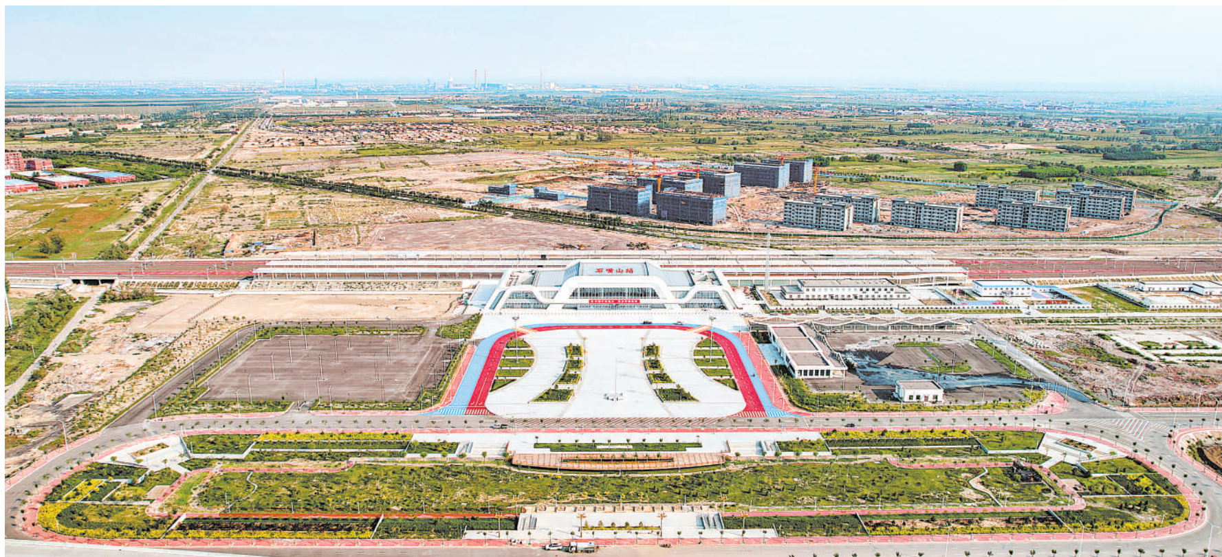
石嘴山站作为包银高铁惠银段新建三座站房中最大的一座,外形轮廓起伏,近似“山”字造型。