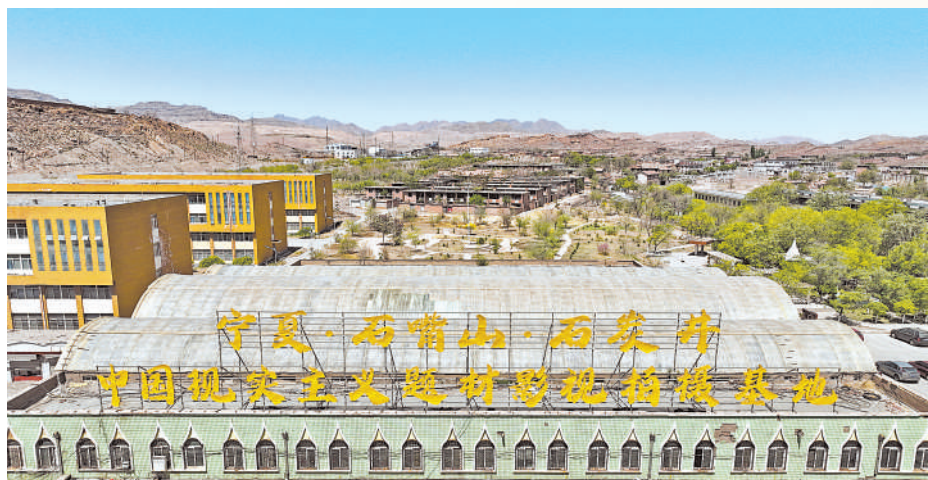
石嘴山大武口区石炭井作为“全国少有,宁夏唯一”的完整工矿行政遗址,矿井、工厂、军事遗址保存完好,借此打造出石炭井工业文旅影视小镇。