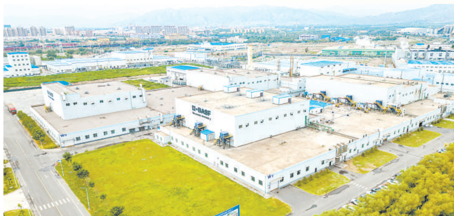
俯瞰巴斯夫杉杉电池材料(宁夏)有限公司厂区。石嘴山是宁夏工业的摇篮,有25个工业门类,是宁夏工业门类最多、产业体系最完备的地级市。