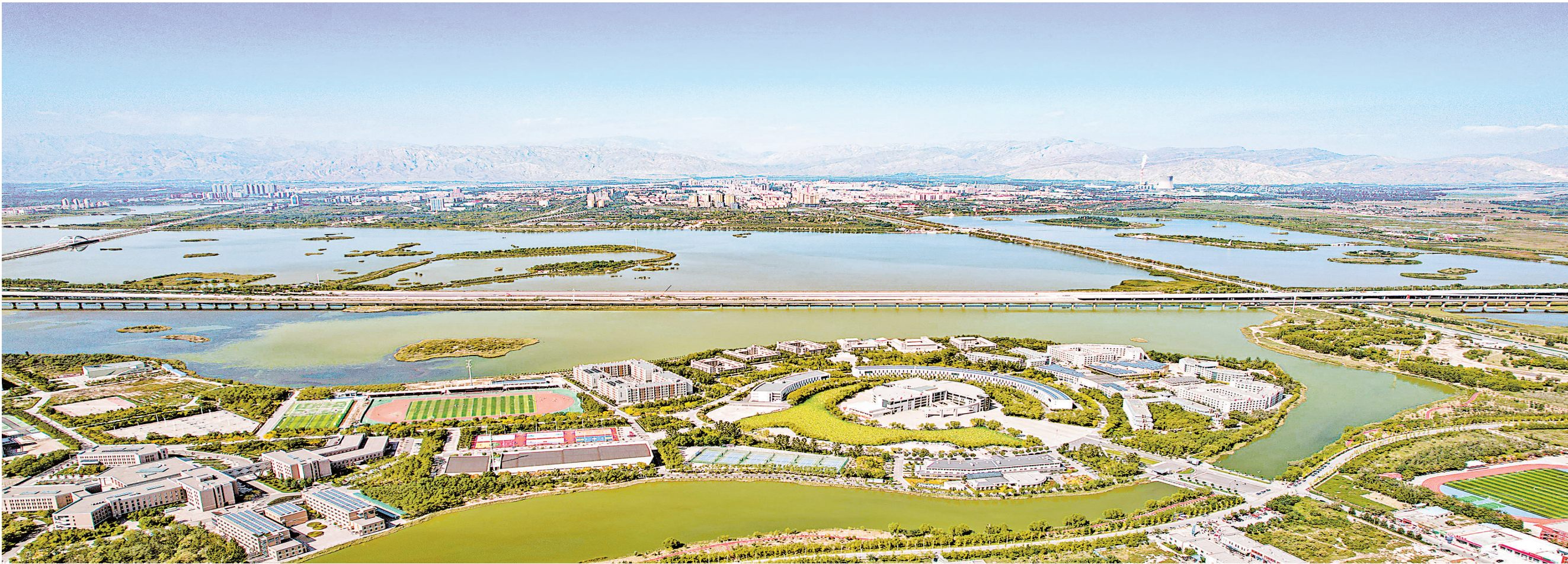
贺兰山下的石嘴山海湖国家湿地公园。