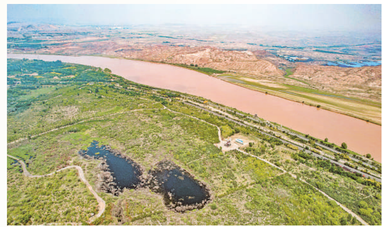
石嘴山市惠农区七彩园由采煤沉陷区治理而成,由七种彩叶树构成。