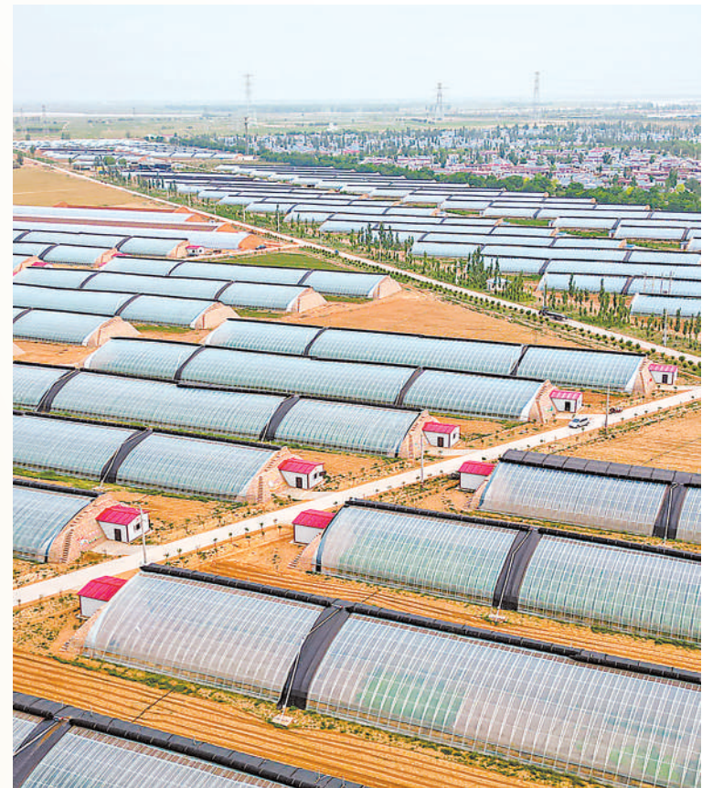
平罗县陶乐镇庙湖村特色沙漠瓜菜产业园。

是安定和谐、民生幸福的文明城市。全国各地的建设者汇聚到石嘴山,形成了工矿文化、城市文化、军旅文化、移民文化等深厚底蕴,先后荣获全国文明城市、国家森林城市、国家卫生城市、全国教育优先发展示范城市、平安中国建设示范市、国家食品安全示范城市等荣誉。牛奶、枸杞、牛羊肉等农业特色产业不断壮大,是全国高端奶之乡、富硒农业产区、蔬菜制种基地、脱水菜生产基地。