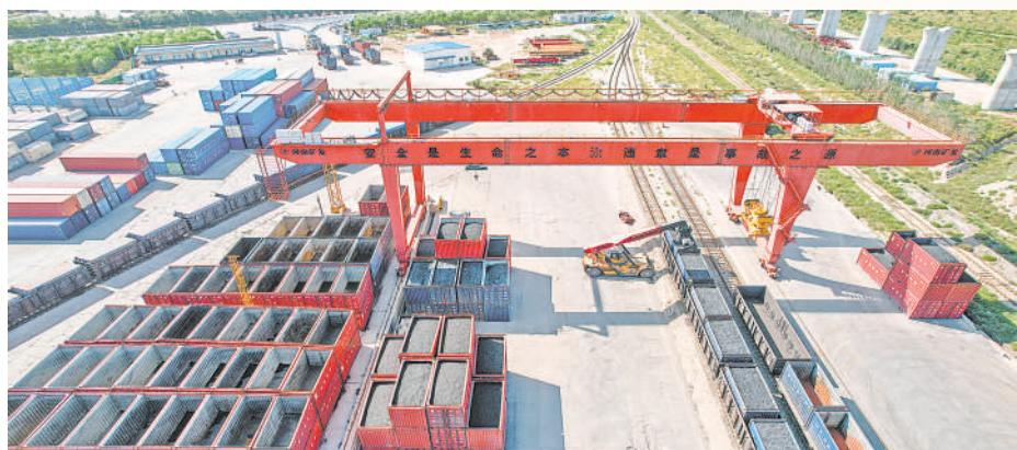
位于石嘴山市惠农区的陆港经济区和保税物流中心(B型)一派繁忙,起重机将装有煤矿和化工原料的集装箱吊运至发往天津港的铁水联运专列上。