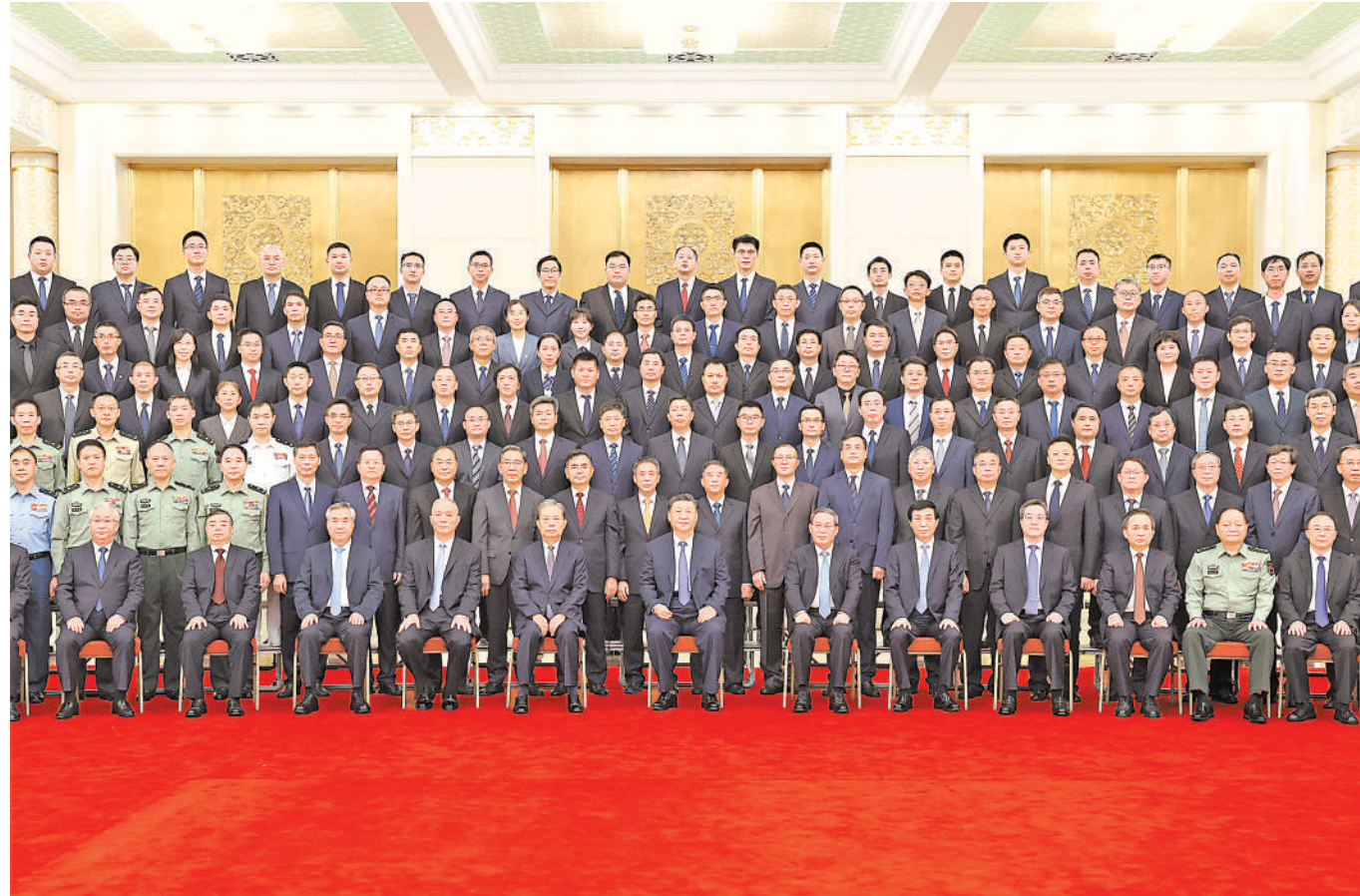
9月23日,党和国家领导人习近平、李强、赵乐际、王沪宁、蔡奇、丁薛祥、李希等在人民大会堂会见探月工程嫦娥六号任务参研参试人员代表并参观月球样品和探月工程成果展览。这是习近平等会见探月工程嫦娥六号任务参研参试人员代表。