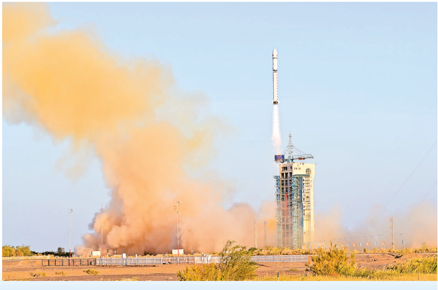
实践十九号卫星顺利进入预定轨道。