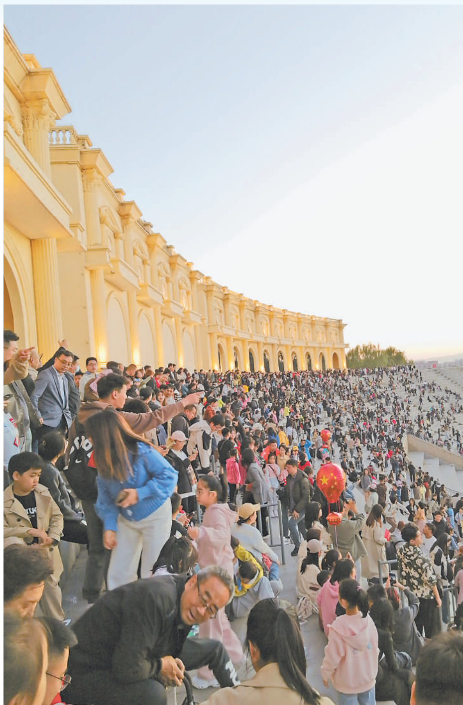
国庆节假期银川览山公园迎来客流高峰,10月1日—4日累计接待游客21万人次。

银川文旅集团自去年接管运营览山公园以来,依托览山资源禀赋,精心培育“览山落日”品牌,在览山创新“文旅+”融合业态,在“自然+人文”资源的基础上,不断创新消费新场景,打造消费新热点,让游客深度参与,不断引起情绪共鸣,到“览山看日落”成为人们到银川的必修课。