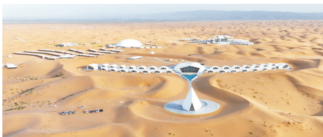
沙坡头旅游景区作为“中国沙漠旅游第一品牌”,持续推出沙漠星星酒店、钻石酒店、沙漠传奇等旅游度假产品,备受游客青睐。