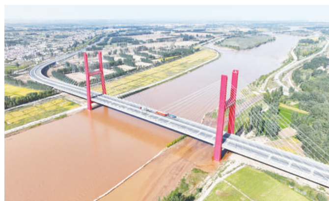
中卫下河沿黄河公路大桥,是目前宁夏主塔最高、桩基最深、单跨跨径最大的斜拉桥。