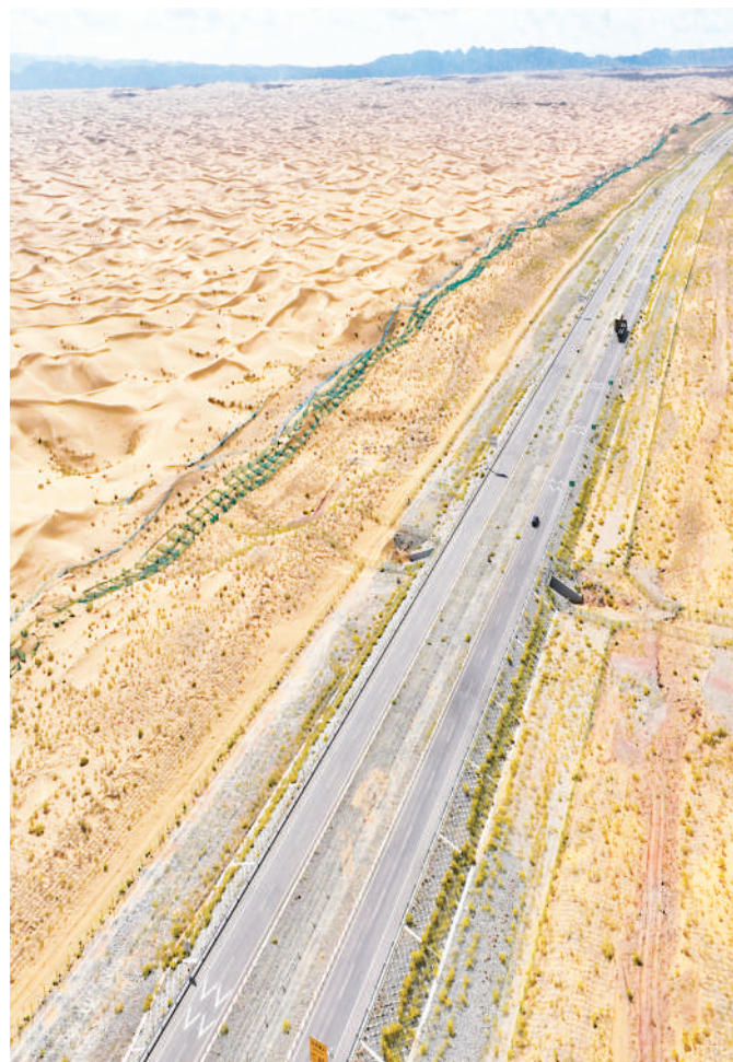
宁夏首条沙漠公路乌玛高速公路青铜峡至中卫段,全长122.99公里,其中18公里穿越腾格里沙漠腹地。