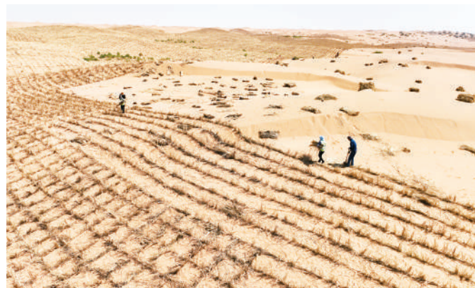
工人在腾格里沙漠扎制被誉为“治沙魔方”的麦草方格。