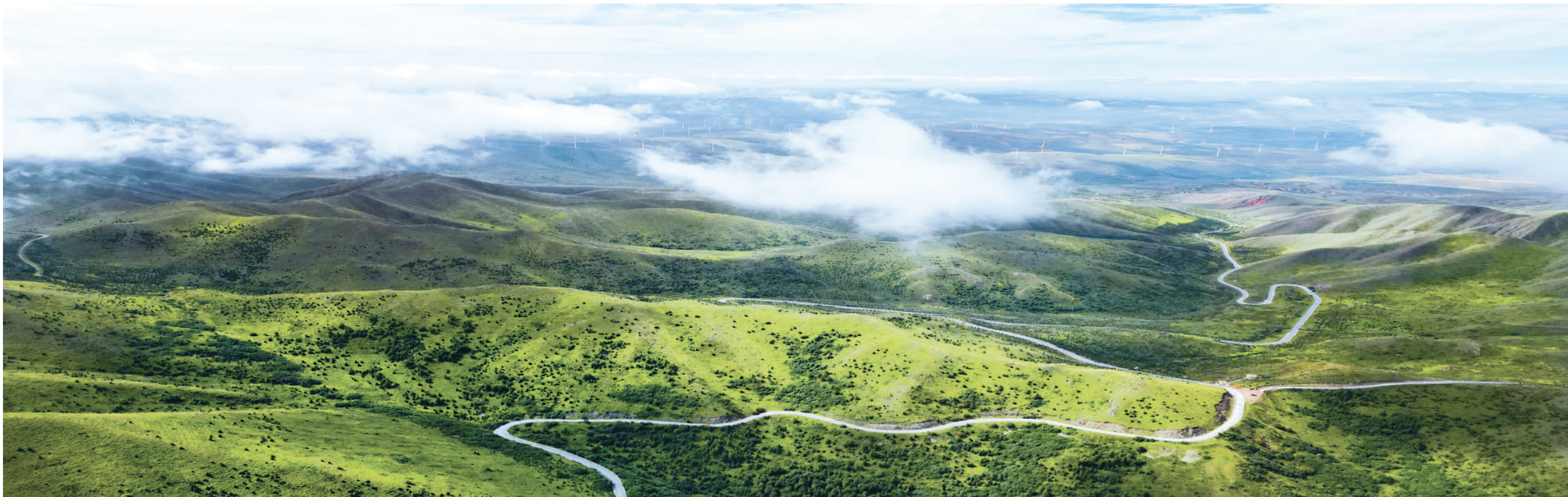
位于海原县的南华山总面积42万亩,平均海拔2600米,是宁夏中部干旱带上重要的水源涵养地。