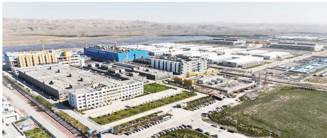
宁夏中关村西部云基地,汇聚了一大批国内外优秀信息技术企业。