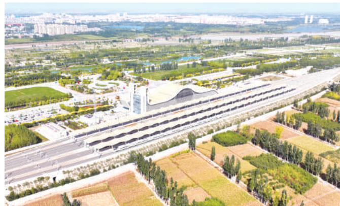
银兰高速铁路中卫南站。

中卫市产业基础雄厚,发展势头强劲。作为全国首个“双中心”城市,中卫市被列入国家十大数据中心集群,建成了全国首个“万卡级”智算基地,云计算和大数据产业发展态势良好。同时,特色产业也享誉全国,枸杞、牛奶、肉牛(羊)、果蔬4个百亿级农业产业集群初步形成,中宁枸杞作为入选国家首批道地中药材认证的唯一枸杞品种,荣获“全国十佳区域品牌”,13个农产品入选全国名特优新农产品名录。