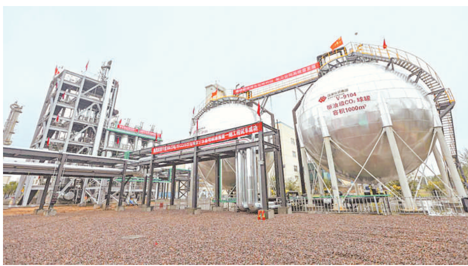
宁夏300万吨/年CCUS示范项目一期工程。

本报讯(记者 丁建峰)10月11日,记者从国家能源集团宁夏煤业有限责任公司获悉,全国最大碳捕集利用与封存全产业链示范基地——宁夏300万吨/年CCUS示范项目一期工程打通10万吨/年工业级生产流程,标志着该项目一期工程建设完成,全线投入生产运行。 宁夏300万吨/年CCUS示范项目是宁东能源化工基地管委会、国家能源集团宁夏煤业有限责任公司与中国石油长庆油田分公司共同合作打造的绿色低碳示范项目,将全球单体规模最大的现代煤化工400万吨/年煤炭间接液化项目排放的二氧化碳气捕集后,由中国最大的油气生产基地长庆油田进行驱油封存。在全球首次实现了现代煤化工和大型油气田开采之间的绿色减碳合作,建成后将成为中国最大碳捕集利用与封存全产业链示范基地。 宁夏300万吨/年CCUS示范项目一期工程以煤制油公司和烯烃一公司低温甲醇洗装置排放的高纯二氧化碳为主要碳源,主要建设50万吨/年二氧化碳捕集液化工程,包含40万吨/年二氧化碳驱油封存工程和