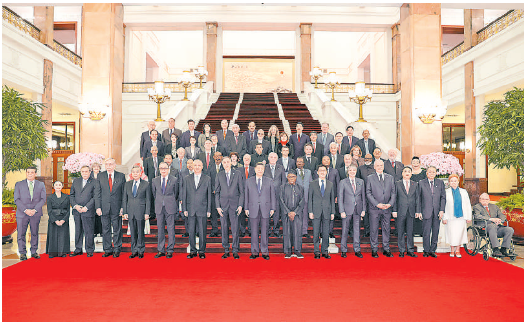
10月11日上午,国家主席习近平在北京人民大会堂集体会见出席中国国际友好大会暨中国人民对外友好协会成立70周年纪念活动的外方嘉宾。这是习近平同部分外方嘉宾代表合影留念。

新华社北京10月11日电 10月11日上午,国家主席习近平在北京人民大会堂集体会见出席中国国际友好大会暨中国人民对外友好协会成立70周年纪念活动的外方嘉宾。 习近平首先同来华出席中国国际友好大会暨中国人民对外友好协会成立70周年纪念活动的部分外方嘉宾代表合影留念,对国际友人长期致力于对华友好事业表示高度赞赏。