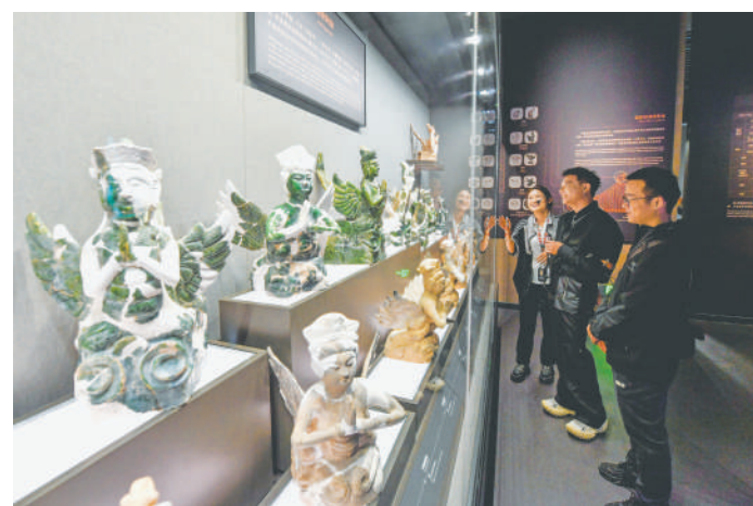
西夏陵出土了多件迎陵频伽,其形人首鸟身,又称“妙音鸟”。