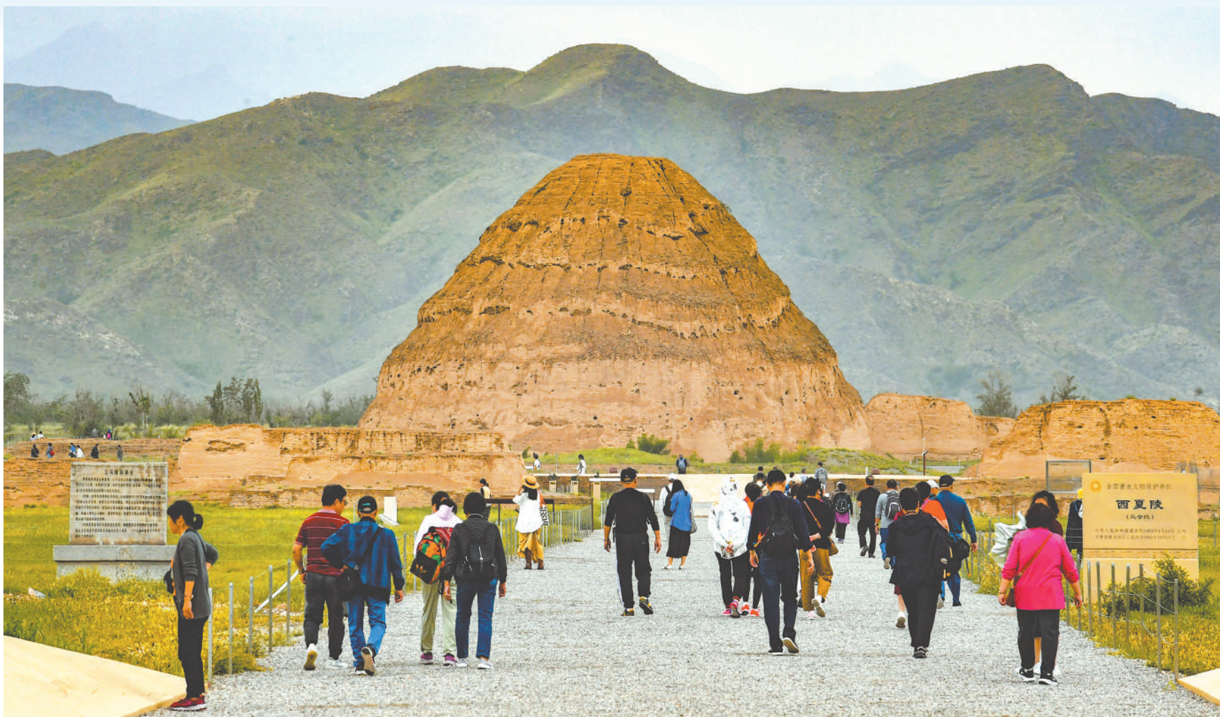
游客在西夏陵游览。