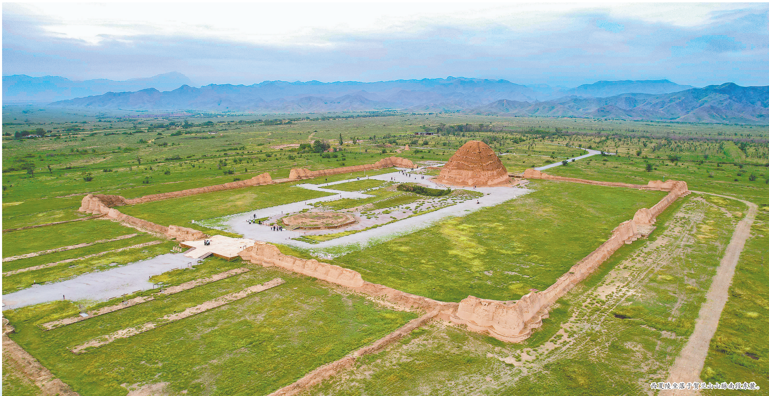
西夏陵坐落于贺兰山脉南段东麓。