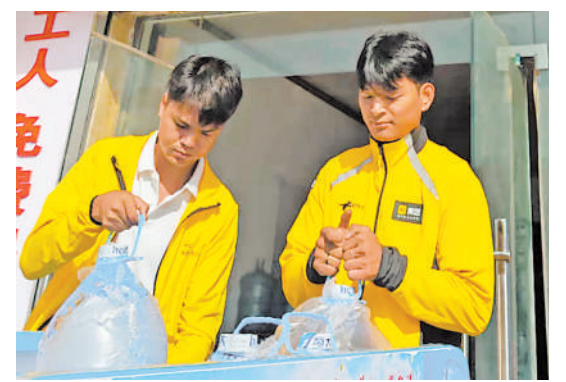
美团骑手将桶装水装上配送车。

近年来,随着县域基础设施的完善和消费观念的升级,作为县域经济的延伸,一批充满发展潜力的小镇因时因地不断“崛起”,如银川市周边,由葡萄酒产业和镇北堡影视城等带动生长的银川市镇北堡漫葡小镇,以及去年以来因乡村大集而爆火的西夏区兴泾镇、贺兰县通贵村等,这些亮点在日渐变大变强的乡镇,折射着县域经济发展的新亮点和新活力,使县域市场孕育的消费活力进一步释放。