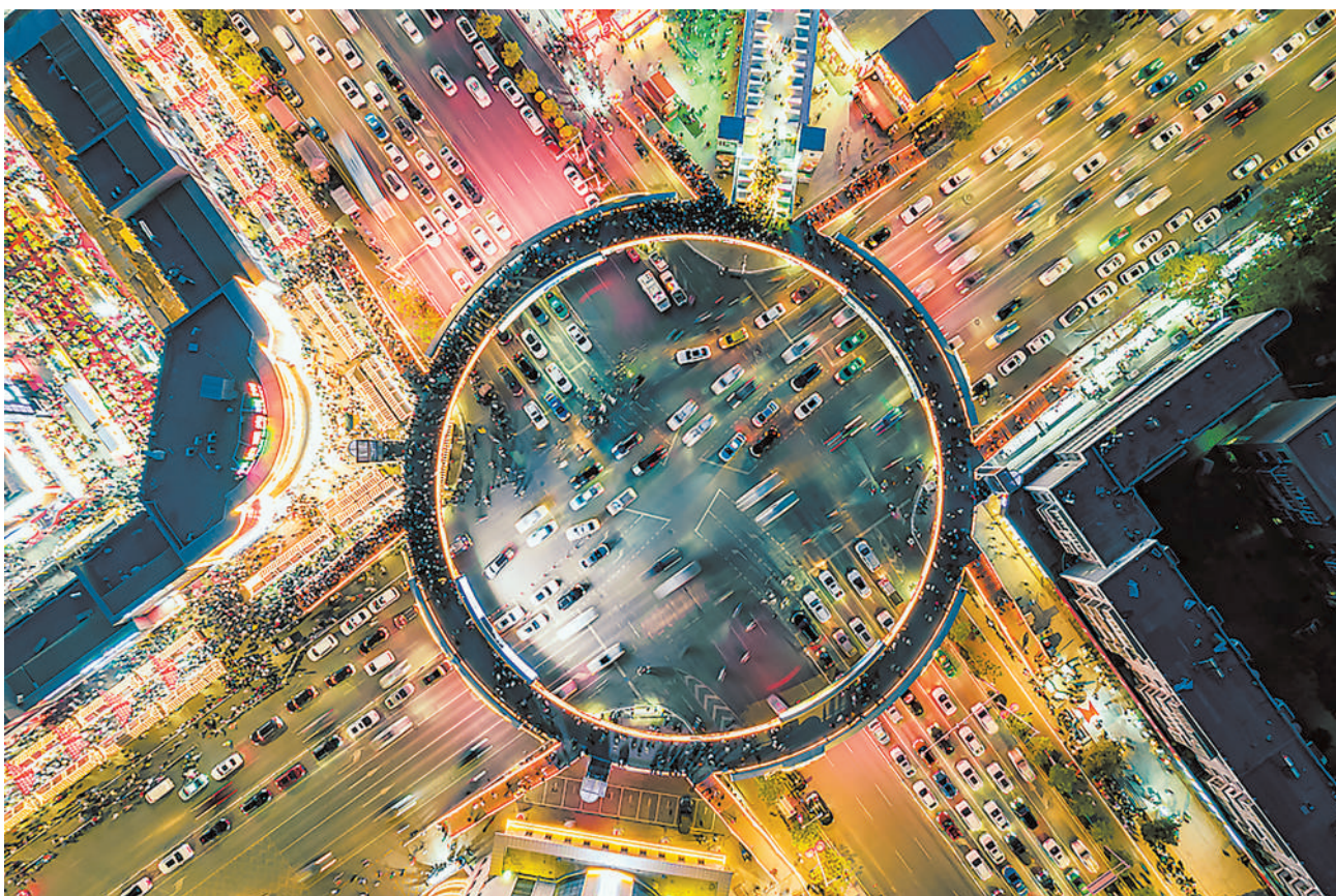
璀璨夜景照亮西夏区。