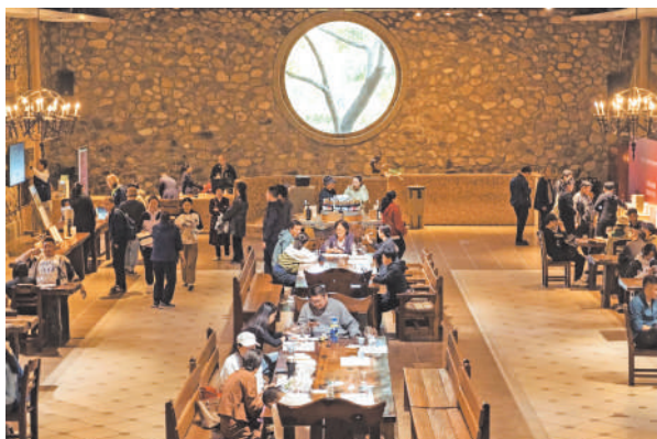
酒庄品酒也是一种生活方式。