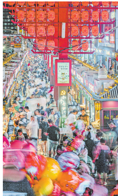
夜经济让生活更加丰富多彩。