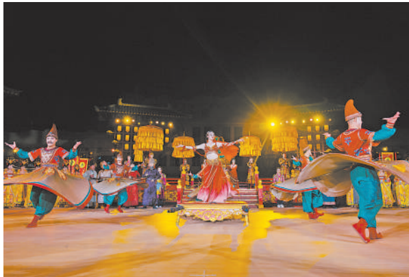
漫葡小镇的胡旋舞表演。

西夏区持续促进“夜”态融合，文旅产品供给更加多元化，以怀远市场、宁夏广场、怀远红西街为着力点，利用景区、旅游街区等资源，增加夜间照明和活动，打造布局合理、功能完善、业态多元、管理规范、夜间经济消费场景。积极推动西夏万达广场、怀远观光夜市等实施智慧化、数字化升级项目，带动民宿、酒店住宿和餐饮消费提升。