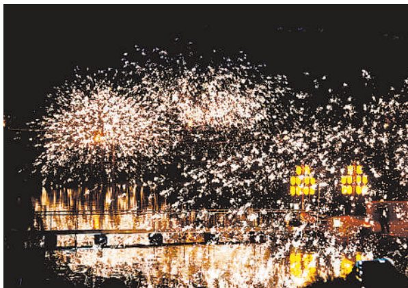
西夏风情园的“打铁花”照亮夜空。