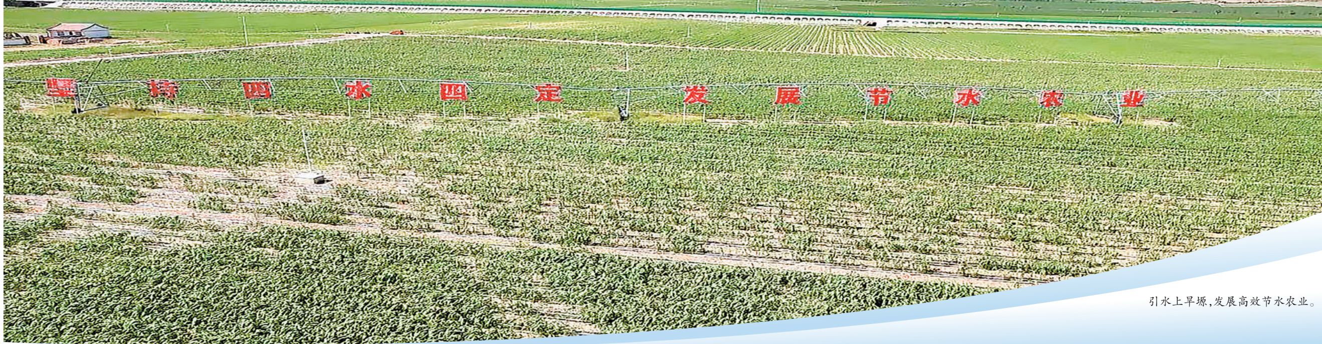
引水上旱滩,发展高效节水农业。

今年以来,海原县聚焦“一主四特”产业,坚持以市场需求为导向,突出发展高端肉牛主导产业和小杂粮、马铃薯、枸杞、瓜菜特色产业,优品类、提品质、延链条、打品牌,着力构建现代农业产业体系、生产体系和经营体系,向现代农业发展之路阔步迈进。