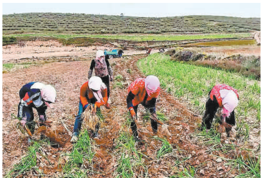
海城镇山门村村民采收红葱。

截至目前,海原县种植枸杞3.16万亩,年产值2.1亿元,带动产区2.3万户9.6万人实现人均年收入2200元。通过政策驱动、科技推动、市场拉动、龙头带动、社会联动等有效措施,在枸杞统防统治、烘干、深加工、包装和销售等方面不断延伸增值产业链,助力枸杞产业跑出乡村振兴加速度。