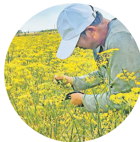
西安镇小茴香产业助农增收。

今年,全县肉牛存栏量稳定在15.2万头,牛肉产量达到1万吨。肉牛饲养总量保持在23.4万头,良种化率达到95%。农民人均养牛收入占经营收入的37.3%。实现全产业链产值32亿元。“通过全产业链集中发力,助力高端肉牛产业实现从行业跟跑向并跑、领跑转变。”海原县农业农村局负责人说。