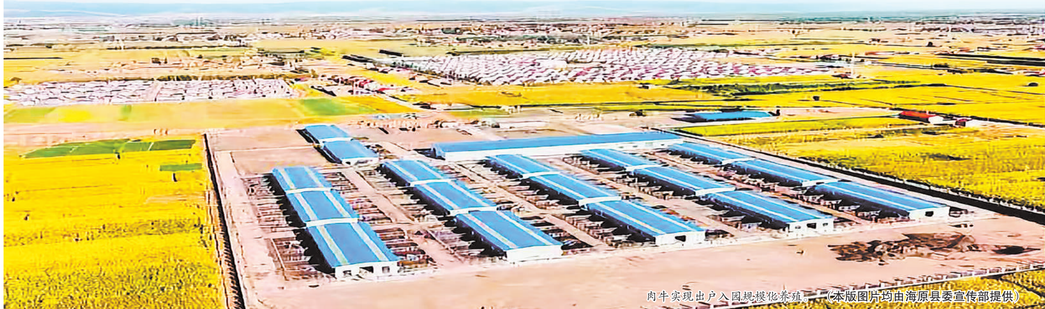
肉牛实现出户入园规模化养殖。