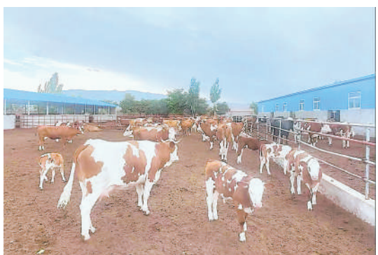
高端肉牛全产业链发展。

今年以来,海原县聚焦“一主四特”产业,坚持以市场需求为导向,突出发展高端肉牛主导产业和小杂粮、马铃薯、枸杞、瓜菜特色产业,优品类、提品质、延链条、打品牌,着力构建现代农业产业体系、生产体系和经营体系,向现代农业发展之路阔步迈进。