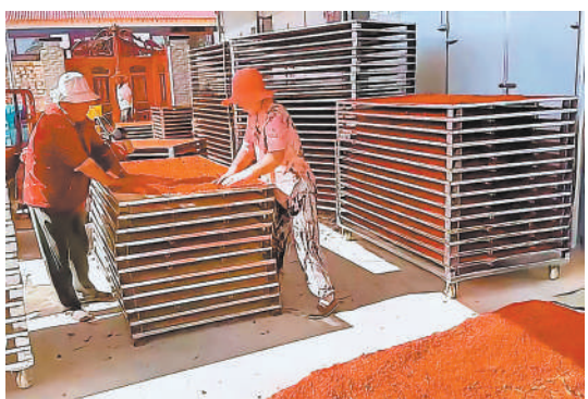
枸杞烘干、分拣、加工一条龙。