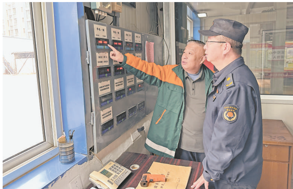
兴庆区综合执法局燃气供热管理办公室工作人员到供热公司检查。

这些供暖“烦心事”,也是群众关注的焦点。近期,记者聚焦这些问题,采访多位法律专业人士和相关部门负责人,逐一解答供暖季的法律“热点”。