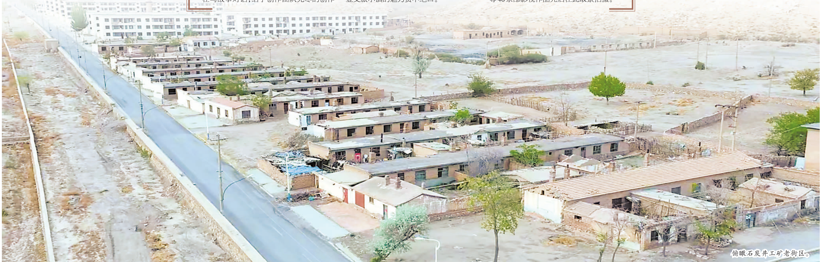
俯瞰石炭井工矿老街区。