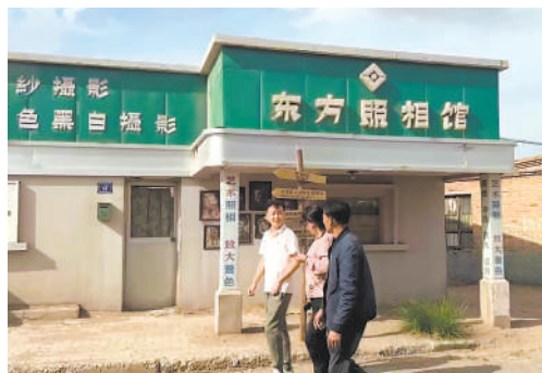
漫步石炭井老街区,穿越感十足。