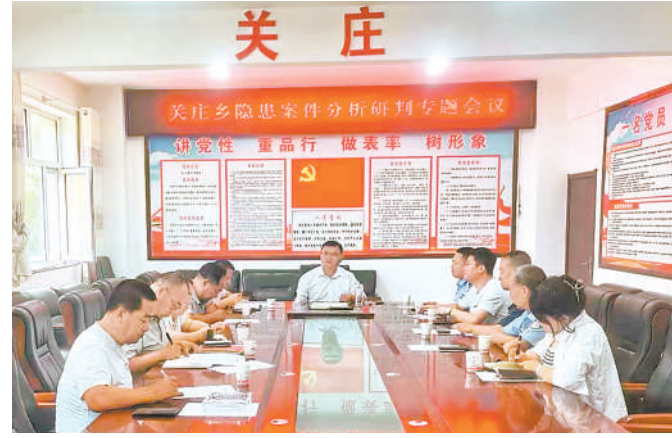
进行风险隐患分析研判。