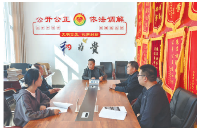
诉源治理减轻群众诉累。