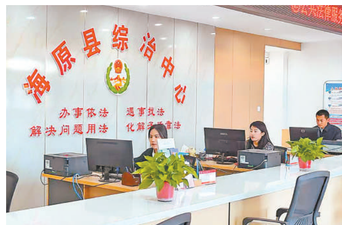
综治中心群众接待大厅。

近年来,海原县坚持和发展新时代“枫桥经验”,聚焦深化社会治理现代化,依托“塞上枫桥”基层法治工作机制,充分发挥县级综治中心指挥中枢作用,构建乡镇(街道)综治中心统筹、村(社区)基层法治工作机制支撑、基层法治力量广泛参与的“塞上枫桥”基层法治工作体系,推动完善矛盾纠纷多元化解机制,共推共促社会和谐稳定,助力建设更高水平的“平安海原”。