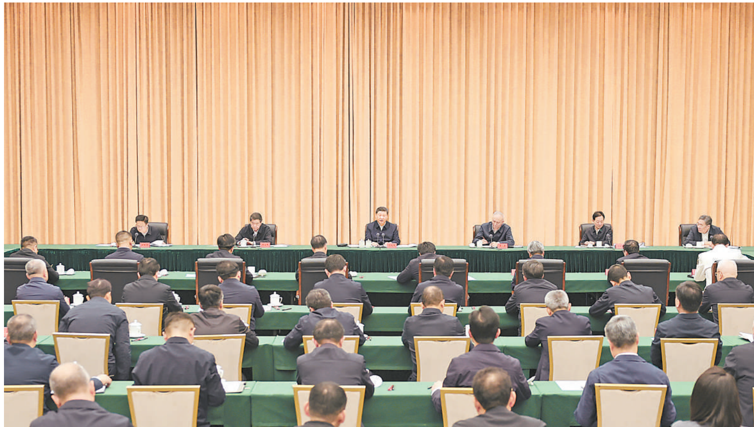
12月17日下午,中共中央总书记、国家主席、中央军委主席习近平在海南三亚听取海南省委和省政府工作汇报,发表了重要讲话。

新华社三亚12月17日电 中共中央总书记、国家主席、中央军委主席习近平在听取海南省委和省政府工作汇报时强调,要全面贯彻党的二十大和二十届二中、三中全会精神,认真落实党中央关于海南自由贸易港建设的各项部署,紧紧围绕建设全面深化改革开放试验区、国家生态文明试验区、国际旅游消费中心、国家重大战略服务保障区的战略定位,科学谋划封关前后的改革开放和高质量发展工作,继续解放思想、开拓创新,攻坚克难、稳步推进,努力把海南自由贸易港打造成为引领我国新时代对外开放的重要门户,奋力谱写中国式现代化海南篇章。