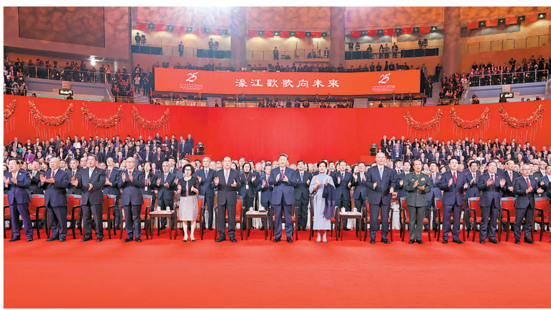
12月19日晚,庆祝澳门回归祖国25周年文艺晚会在澳门东亚运动会体育馆举行。中共中央总书记、国家主席、中央军委主席习近平观看演出。晚会最后,习近平同全场观众一起高唱《歌唱祖国》。