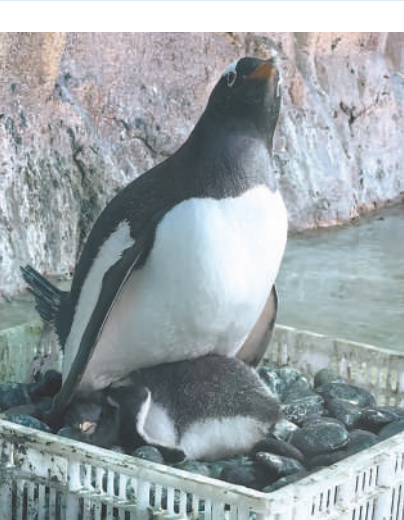
企鹅爸爸孵化下的小企鹅。