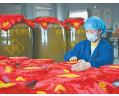
工人在五渡桥村五渡尚品老酒坊检查酒缸,查看发酵情况。

近年来,边桥村探索发展设施农业,做足大棚经济“文章”。通过积极推广农业新技术,指导农户逐渐调整传统种植模式加入特色种植行列,让温室大棚成为农民增收致富的“金钥匙”。2024年,该村人均收入近1.5万元。