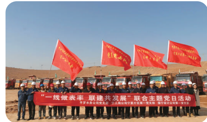
党建引领高质量发展。