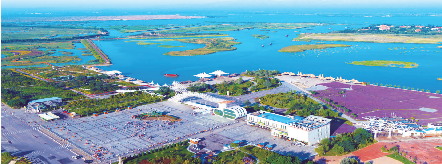
沙湖碧水花海映远山。

坚持把党纪学习教育作为重要政治任务,依托中心组学习会等形式开展集中学习、专题研讨,共举办专题读书班260余期,中心组学习会1200余次,交流研讨8744人次。组织参观警示教育基地490次,旁听职务犯罪庭审66次,开展“典型案例大家谈”903次、用身边事教育身边人1353次等,形成推进国资国企高质量发展的强大动力和合力。