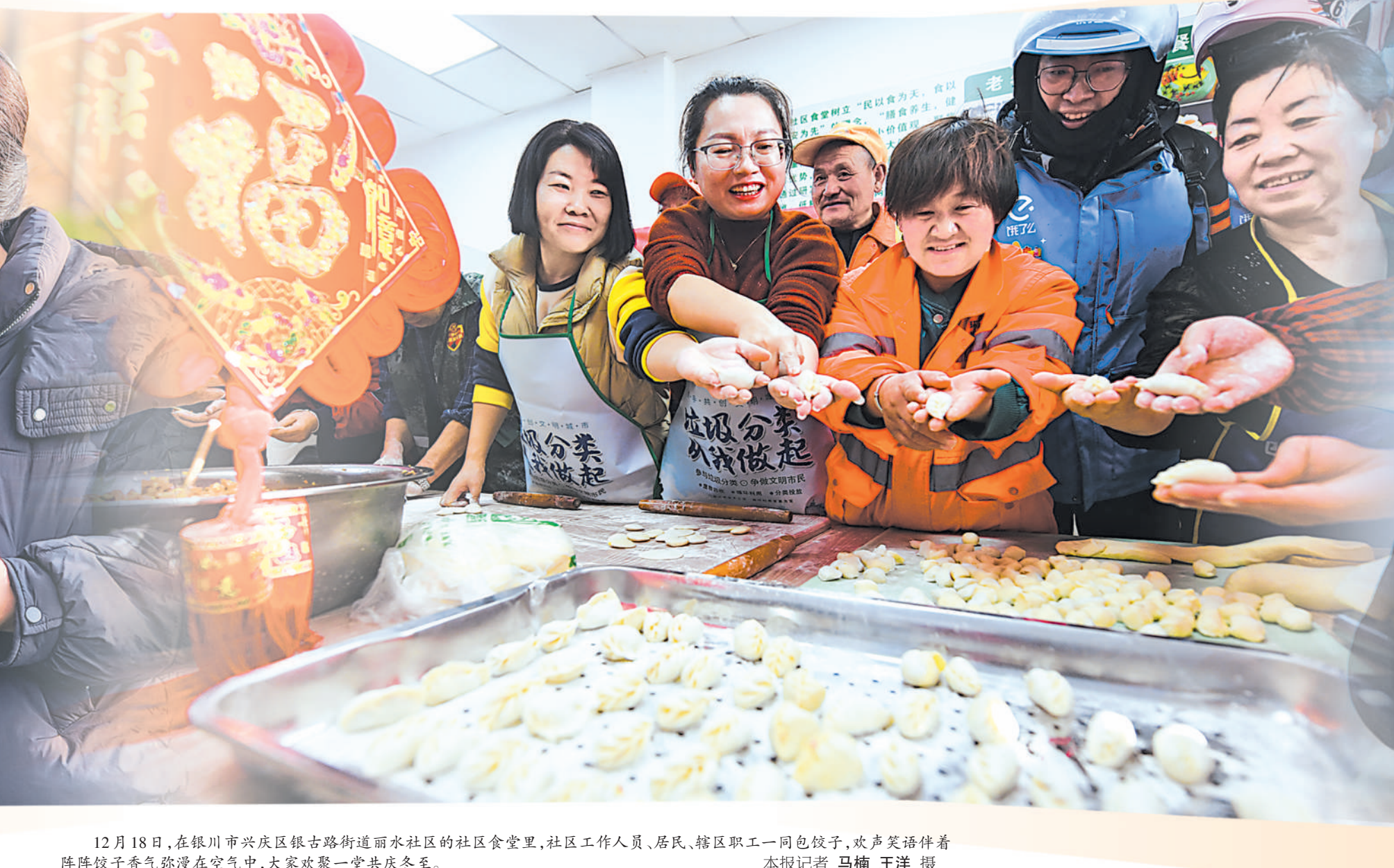
12月18日,在银川市兴庆区银古路街道丽水社区的社区食堂里,社区工作人员、居民、辖区职工一同包饺子,欢声笑语伴着阵阵饺子香气弥漫在空气中,大家欢聚一堂共庆冬至。