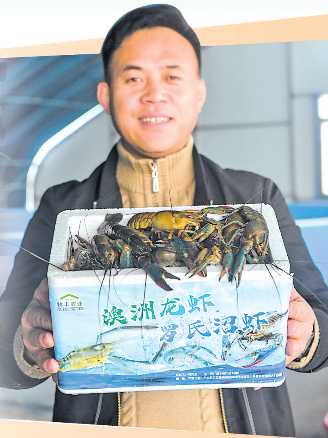
12月19日,位于石嘴山市大武口区星海镇的宁夏牧羊农业专业合作社,工作人员在日光温棚内展示刚刚捕捞的澳洲淡水龙虾。经过3个多月的养殖,该合作社的龙虾单只重量均达到130克以上。

升学 苏晨杰: 从挫折迷茫中走向成功 宁夏日报报业集团旗下全媒体记者 焦小飞 12月24日,临近期末,东南大学吴健雄学院2024级学生苏晨杰格外忙碌,大多数时间都泡在图书馆,记笔记、改错题,遇到难题向老师或同学请教……学习压力与节奏似乎与高中无异,但他的心态却是快乐与平和的,他说:“从挫折中走来,现在一切刚刚好。” 中考后进入银川一中,苏晨杰一度放松学习,导致高一、高二学习成绩持续下滑。南京是苏晨杰向往的地方,但一年多前,“一落千丈”的成绩让他对能否考上大学都打了问号。 苏晨杰的爸爸是名退役军人,一向对儿子要求严格,看到苏晨杰表现“糟糕”,就忍不住责骂,导致亲子关系紧张。“当时感觉我们都快抑郁了,但问题还得解决。于是,我在学校附近租房子阅读,共同分析儿子学习成绩下滑的原因。通过分析,我们制定了学习目标与计划,同时征求老师意见,支持孩子参与学校的一些活动。孩子有了目标,性格也逐渐开朗起来。”苏晨杰的爸爸说。 父母的支持和陪伴给了苏晨杰克服困难的勇气。进入高三,苏晨杰被同学们的认真学习热情所感染,但却不知道该如何着手。为此,每次考试之后,他都找老师聊,寻找突破点,培养做题的感觉。 “高三第一学期我下了很大功夫,每天晚上能刷3套卷子,但因为基础不扎实,成绩并不稳定,直到第二学期,成绩才越来越好,高考数学考了137分,是高中三年中最好的成绩。”苏晨杰说。 开始大学生活后,苏晨杰给自己立下新目标。他推崇知行合一,相信实践出真知,路虽远,行则必达。