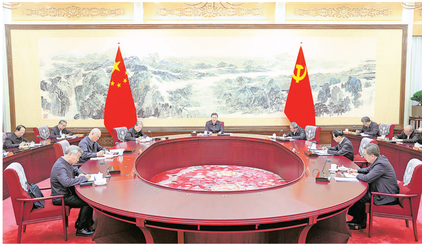
12月26日至27日,中共中央政治局召开民主生活会,中共中央总书记习近平主持会议并发表重要讲话。