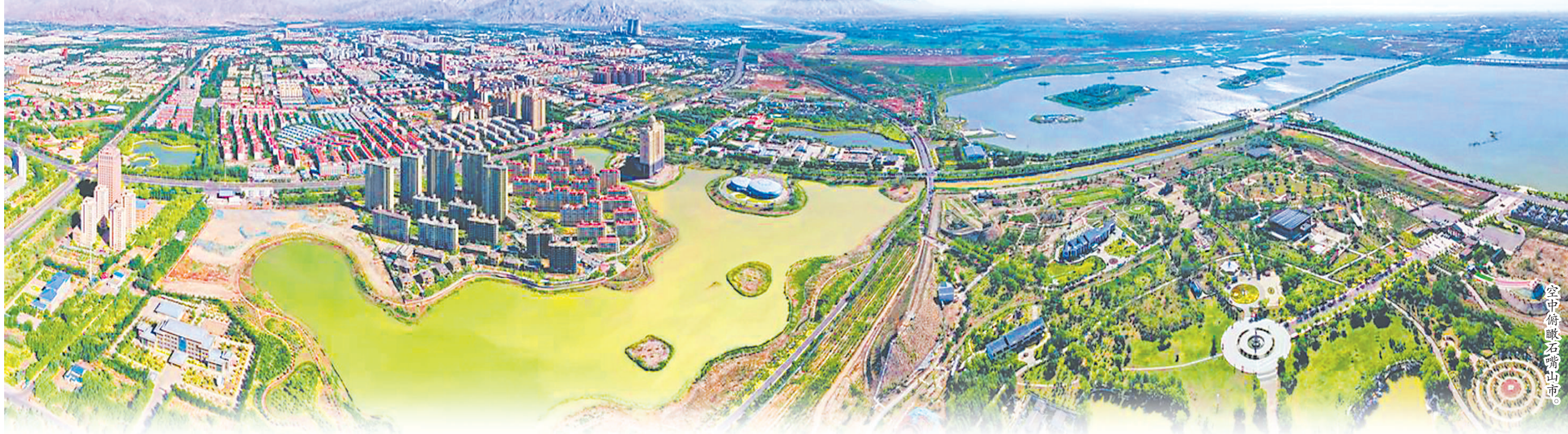
空中俯瞰石嘴山市。

在时代浪潮的推动下，石嘴山市踏上经济转型新征程。2024年，石嘴山市锚定实体经济这个根基，将提升产业质量与效益作为核心任务，全力推动特色优势产业加快发展，积极探索新质生产力培育路径，大力推进产业结构优化升级，精心绘制产业转型示范市发展蓝图，奏响奋力谱写中国式现代化石嘴山篇章的激昂乐章。