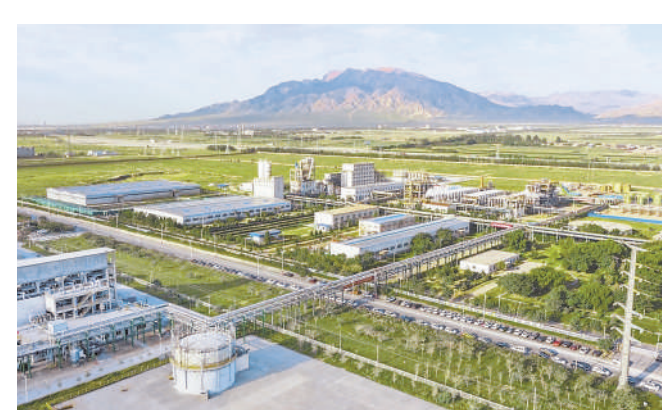
宁夏英力特化工股份有限公司全景。

在这一年的工业转型进程中，石嘴山市收获了丰硕成果。新增规模以上企业9家，绿色工厂5家，数字化车间4家。1月至11月，规上工业增加值增长4.8%，较上年同期大幅提升，充分展现出石嘴山市工业转型发展的强劲韧性与巨大潜力。其中，规模以上制造业增加值增长10.3%，新动能培育加快；装备制造增加值增长23.4%、高技术制造业增加值增长35.9%，成为推动工业发展的重要力量；大中型企业增长6.2%，对规上工业增长的贡献为83.9%；永生科技(宁夏)有限公司、宁夏鑫泽新材料科技有限公司、宁夏福泰材料科技有限公司等9家新入库企业实现产值8.9亿元，拉动规上工业增加值增长0.8个百分点。