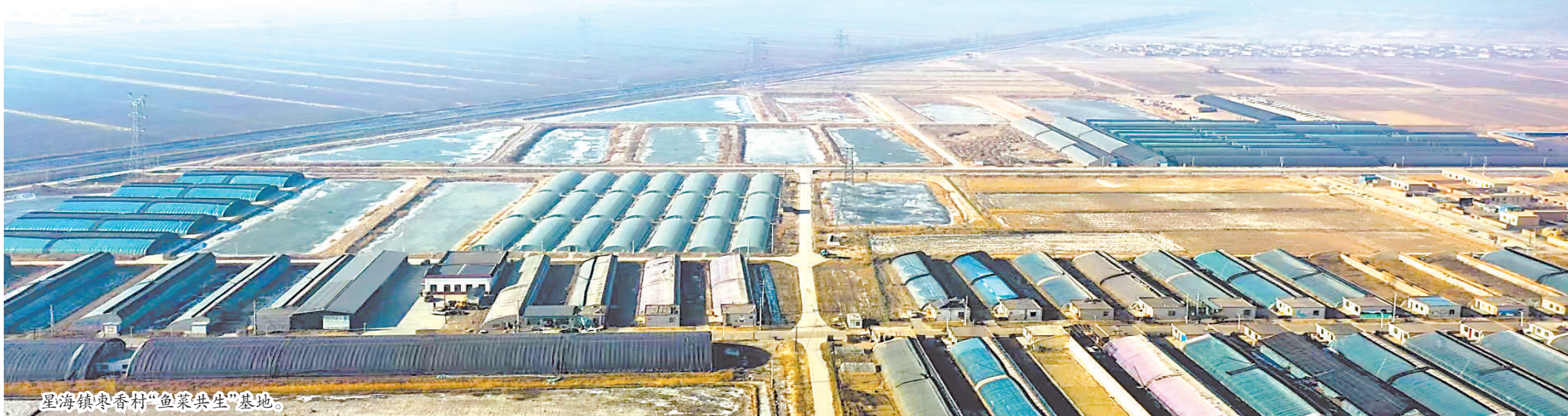
星海镇枣香村“鱼菜共生”基地。