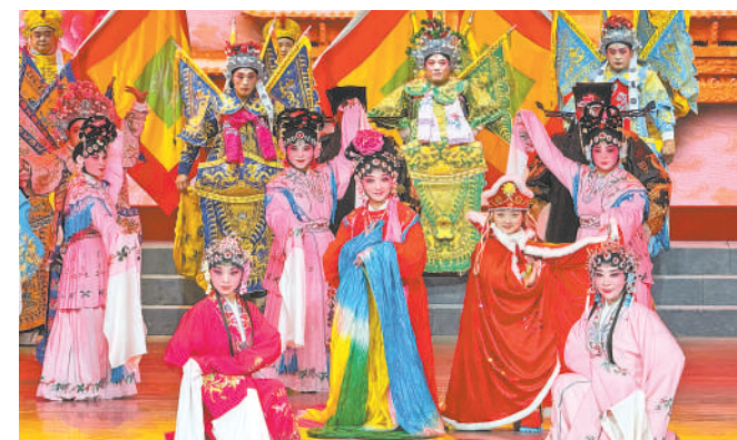
沿黄九省(区)票友齐聚石嘴山，共赏戏曲之美。