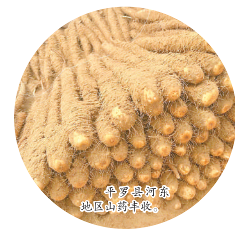
平罗县河东地区山药丰收。