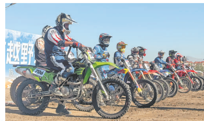
各地骑手前来参加贺兰山汽车摩托车越野赛暨大武口区工业文旅嘉年华活动。