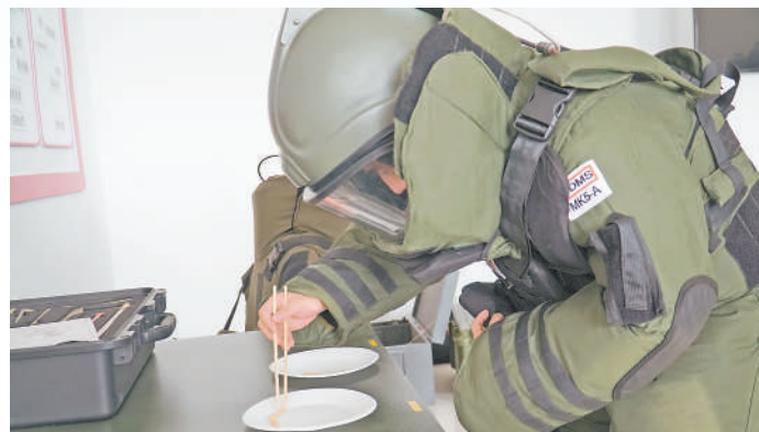
记者体验“穿针引线”。