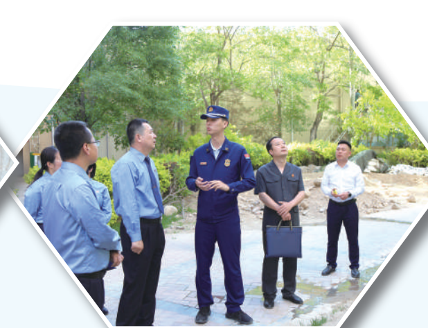
银川市人民检察院、人民法院和消防救援大队到某小区实地勘察、现场办案。