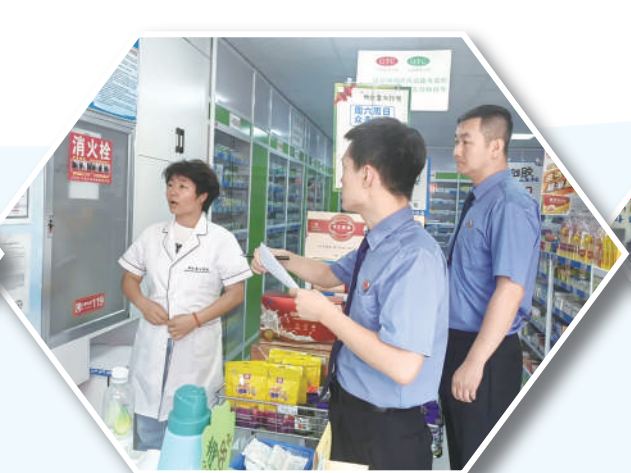
银川市金凤区人民检察院检察官到辖区部分零售药店开展实地检查。