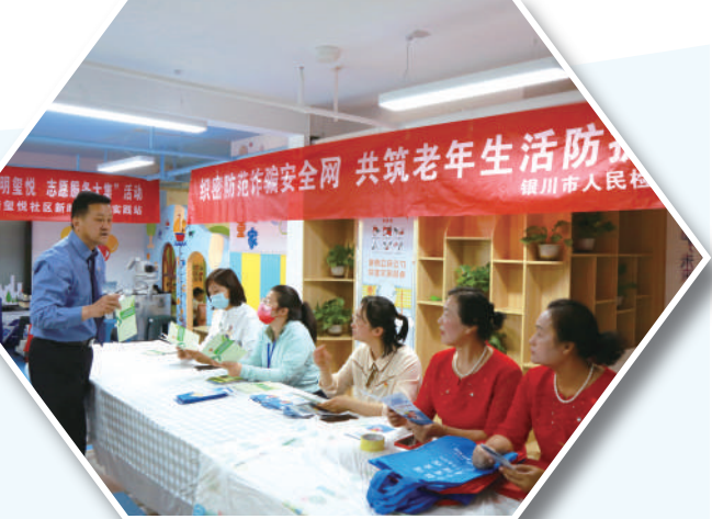
银川市人民检察院检察官走进社区,为群众讲解养老反诈知识。