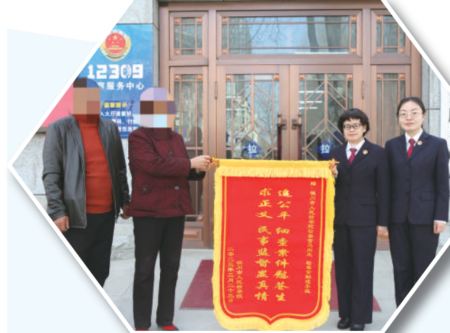
案件当事人为银川市人民检察院检察官送来锦旗。

建设过硬检察队伍。坚持系统观念、法治思维、强基导向,进一步激发检察队伍生机活力,常态化推进学纪知纪明纪守纪,严格落实新时代政法干警“十个严禁”,完善检察权运行制约监督机制,引导检察人员增强党性、严守纪律、砥砺作风。