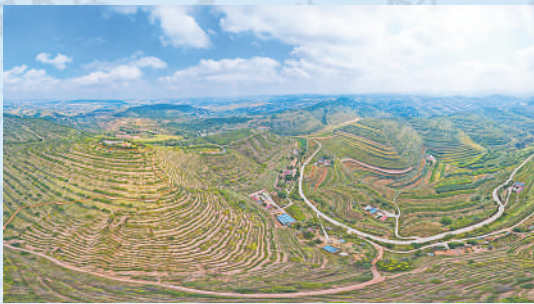
夏秋时节，六盘山区万亩梯田各种作物长势喜人，从空中俯瞰犹如大地的指纹般震撼壮美。

固原，冬。 风过古雁岭，雪落萧关口。六盘山上高峰，红旗漫卷西风。山上，松枝轻舞节节疾；山下，温棚春色催新芽，紫紫嫣嫣藏古今。 走好新时代长征路，山水固原又山水，一季颜色一季新，岁岁年年。 固原，跟上了新时代的步伐，铿锵有力。