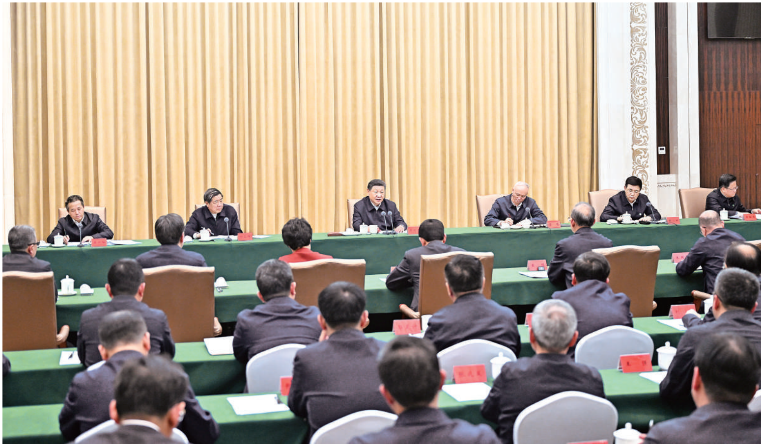
2月8日上午,中共中央总书记、国家主席、中央军委主席习近平在吉林省长春市听取吉林省委和省政府工作汇报,发表了重要讲话。