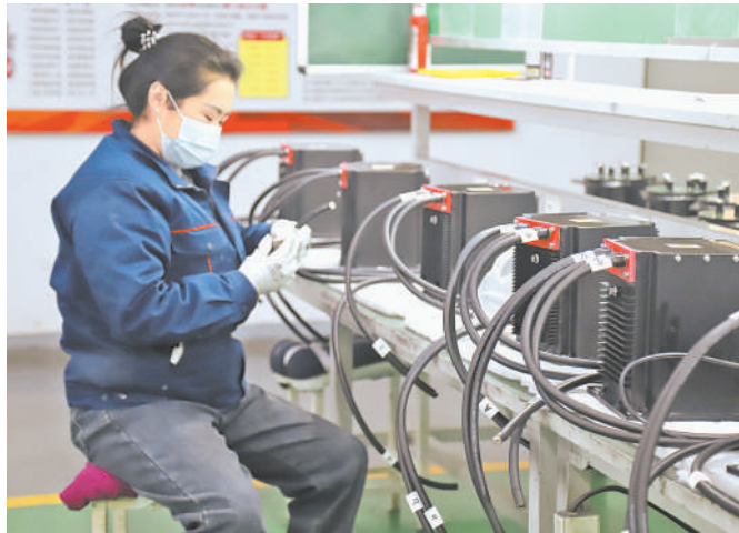
宁夏银利电气股份有限公司生产线。