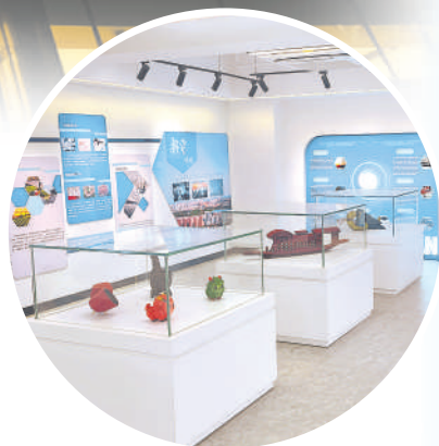
银川(深圳)新质生产力科创中心展示大厅。