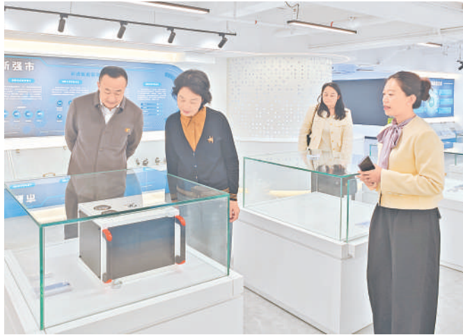
银川(深圳)新质生产力科创中心展示的宁夏好物。