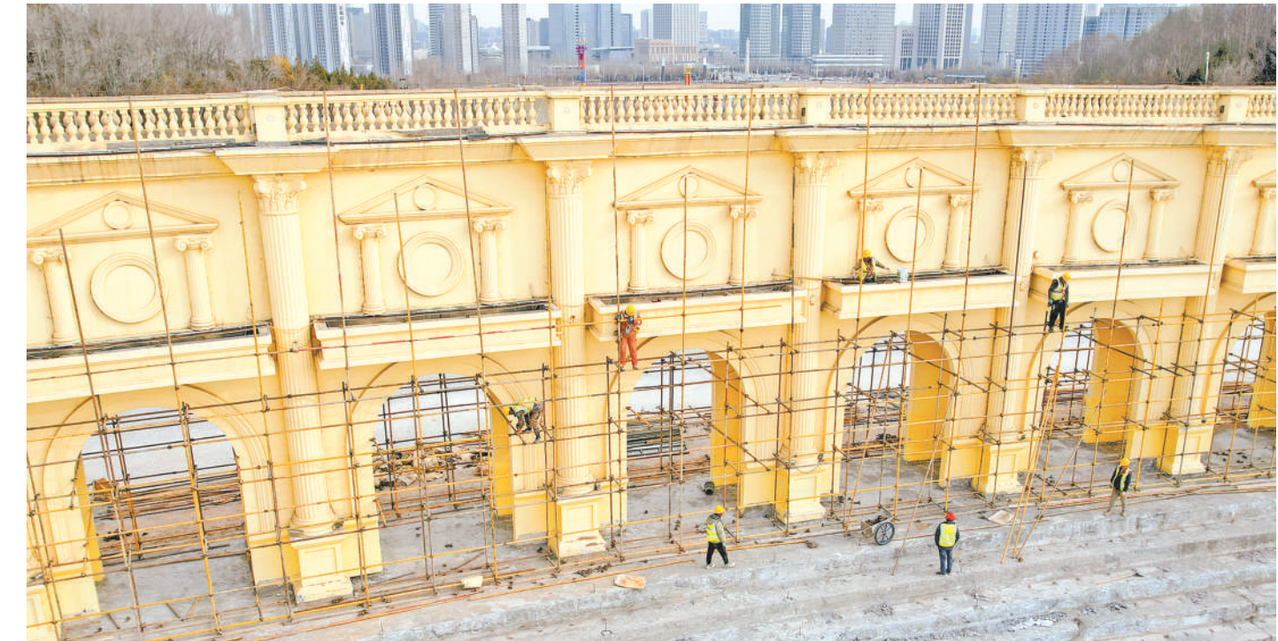
2月19日，银川览山公园门厅加固、廊廊纠斜工程正在同步进行。据悉，览山公园今年5月山体加固项目施工完毕后面向公众开放。

押授信，为企业贷款2400万元，用于购买工程材料，助力企业渡过难关。2024年，西夏区积极拓展土地经营权金融入市通道，聚焦金融赋能与资产增值，引导辖区金融机构为14家企业融资10.8亿元。 银川市以打造赋能全区、服务毗邻、策源西北的区域科技和金融中心为着力点，组建发展担保基金，围绕重点领域开发差异化、特色化的信贷产品，全力提升金融服务效能。今年，以“政银企”对接为抓手，引导金融机构围绕“三都五基地”“两地五中心”等重点领域加大信贷投放，力争本年度新增各项贷款300亿元以上。通过推进权益类质押贷款，确保普惠小微贷款“两增”。同时，实施现代金融赋能行动，以闽海湾科创港为中心，提升金融机构聚集效应，引进风险防控系统，力争引进15家以上基金类机构。