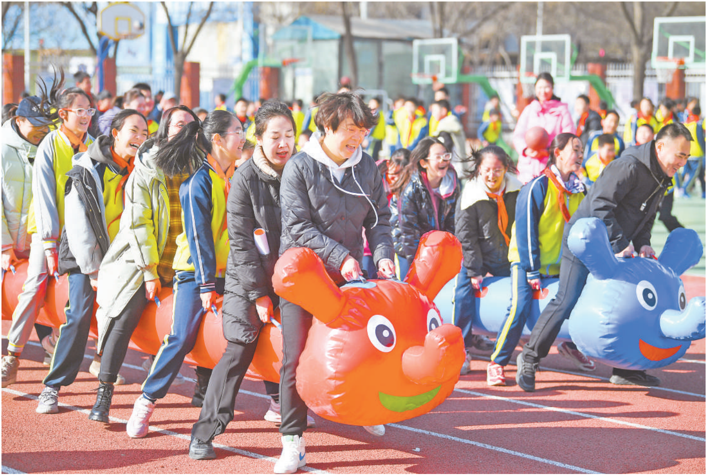
2月25日，银川市兴庆区第四小学操场上，到处是师生们欢快运动的身影。学校通过开展各项体育运动，进一步丰富课间活动内容，让学生们健康快乐成长。

截至目前，西安镇白吉村、曹洼乡脱烈村、史店乡史店村等6个村已打造甘草杏汁、苦荞茶、果脯、蜂蜜水、手工醋等特色产品20余款，开创创办超市3家，参加海南全国特产展等各级各类展会8场次，签订订单10余笔300余万元。同时通过“帮帮团”资源，吸引宁夏大学双创学院、宁夏农林科学院等高校院所参与到村级集体经济发展中，预计今年年底6个村村级集体经济收入将突破百万元。