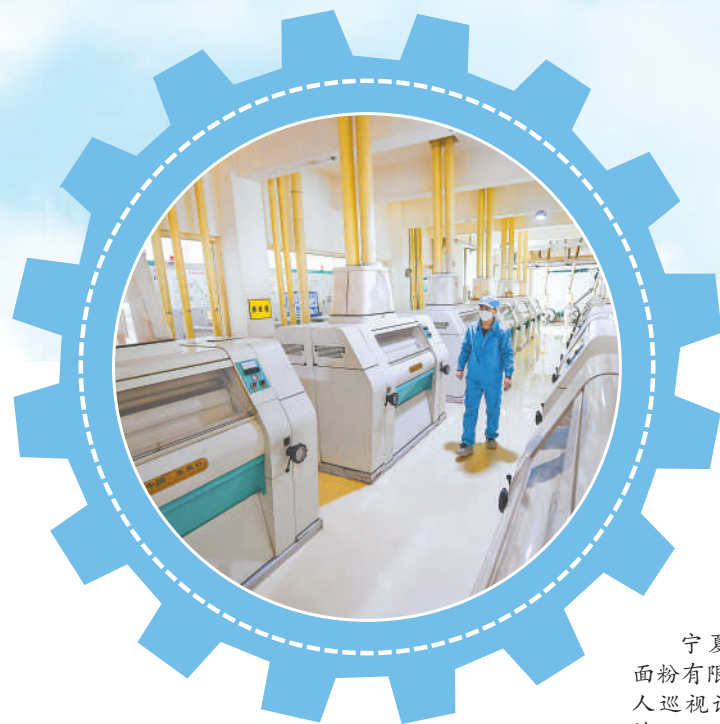
宁夏塞北雪面粉有限公司,工人巡视设备运行情况。

“我们通过构建完善诊断指导、对标提升、融通对接、精准服务和成长评价闭环管理体系,进一步加强我区优质中小企业梯度培育工作,推动中小企业高质量发展。截至2024年底,全区累计培育认定自治区创新型中小企业692家、自治区‘专精特新’中小企业574家、国家‘小巨人’企业28家。”自治区工业和信息化厅工作人员告诉记者,今年将坚持普惠发展和重点培优两手抓,以规模和质量双提升为目标,进一步激发中小企业创新活力和发展动力,提升中小企业竞争力,助力中小企业专精特新发展。