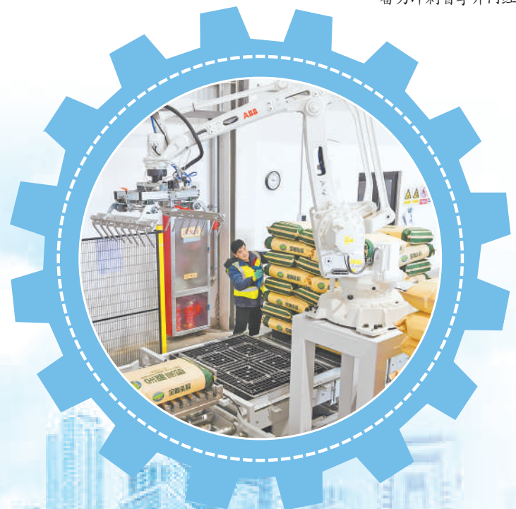
宁夏富杨食品有限公司,机械臂在搬运乳粉产品。