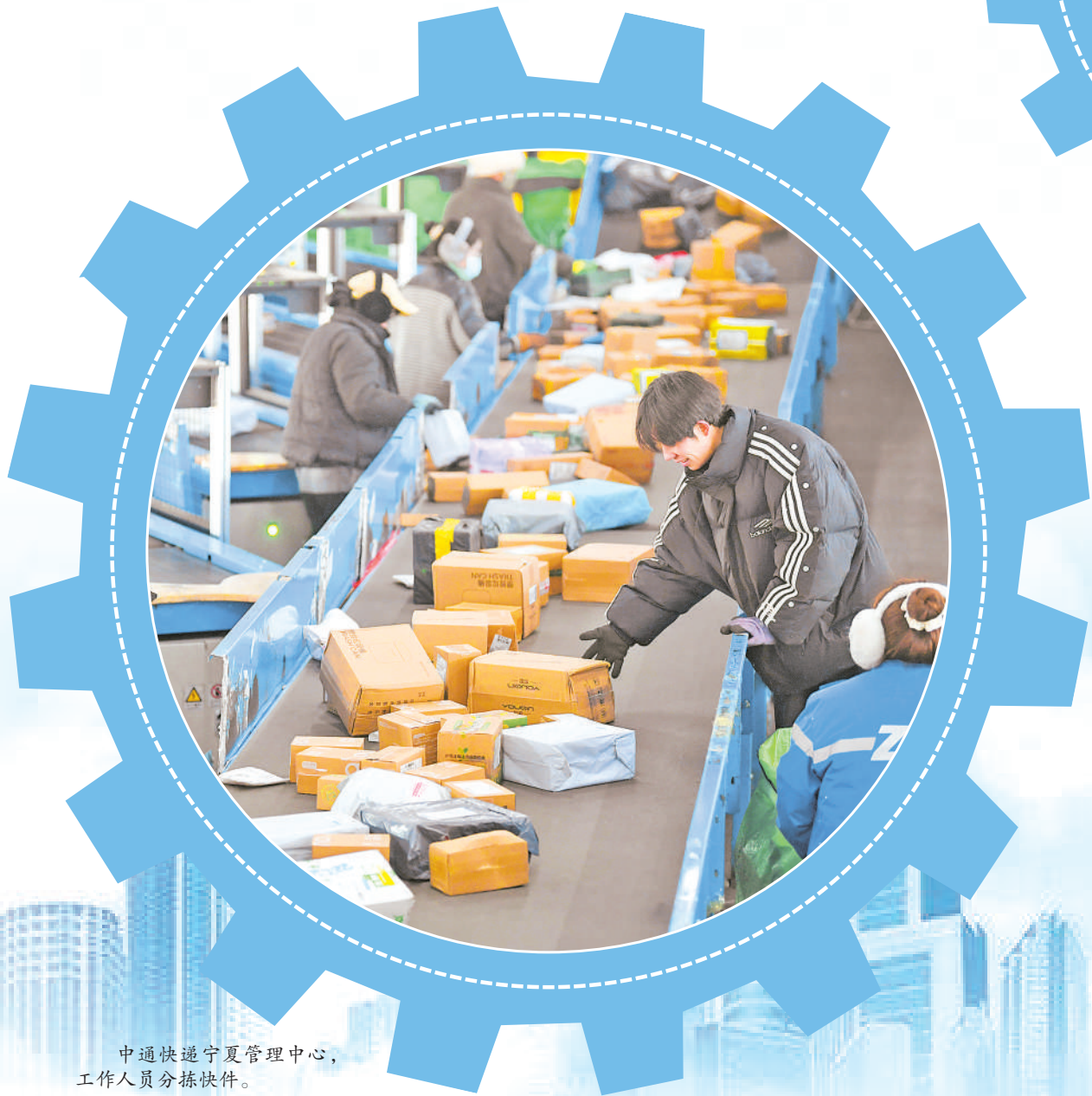
中通快递宁夏管理中心,工作人员分拣快件。