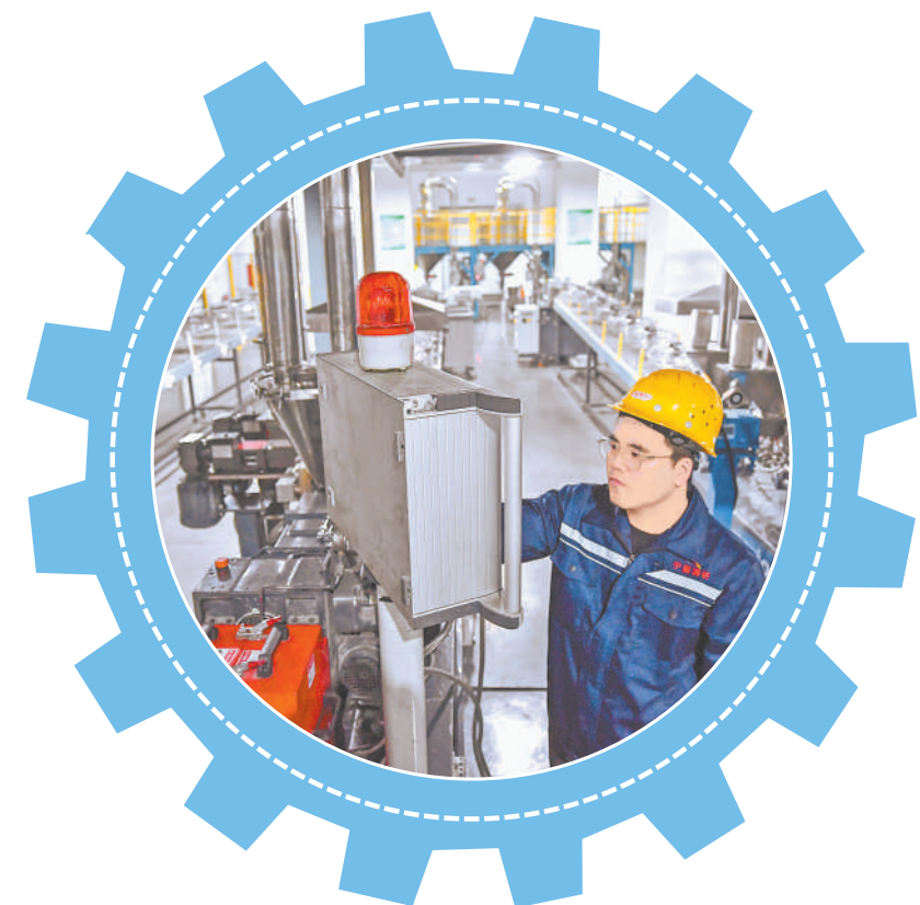
宁夏清研高分子新材料有限公司生产车间内,工作人员查看工程塑料挤出机的运转情况。