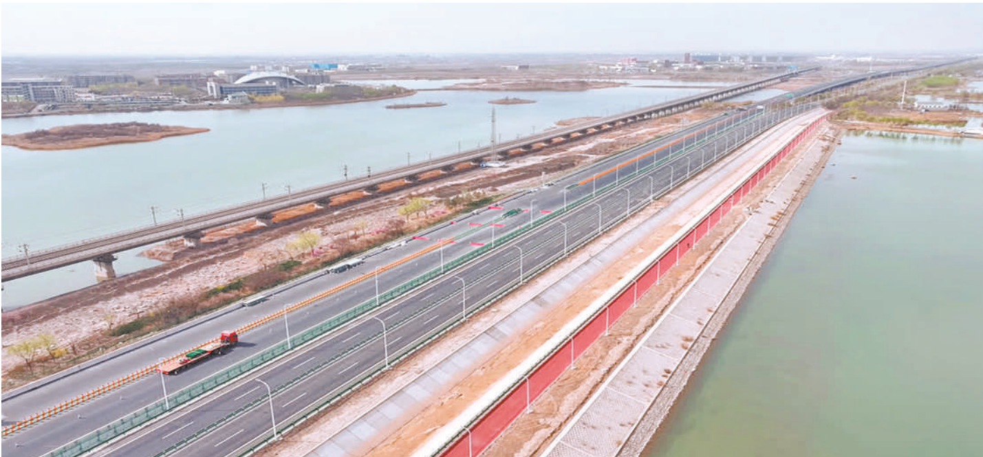
近日，乌玛高速公路惠农（蒙宁界）至石嘴山段主体工程完工，附属工程有序推进，预计今年8月通车。