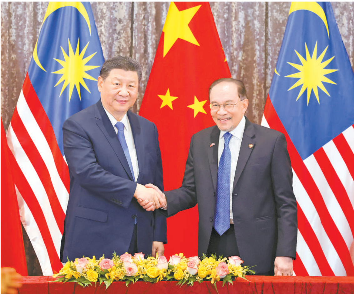
4月16日下午,国家主席习近平同马来西亚总理安瓦尔在布特拉加亚总理官邸举行会谈。会谈后,两国领导人共同见证中马双方交换双边合作文本。这是习近平同安瓦尔握手。