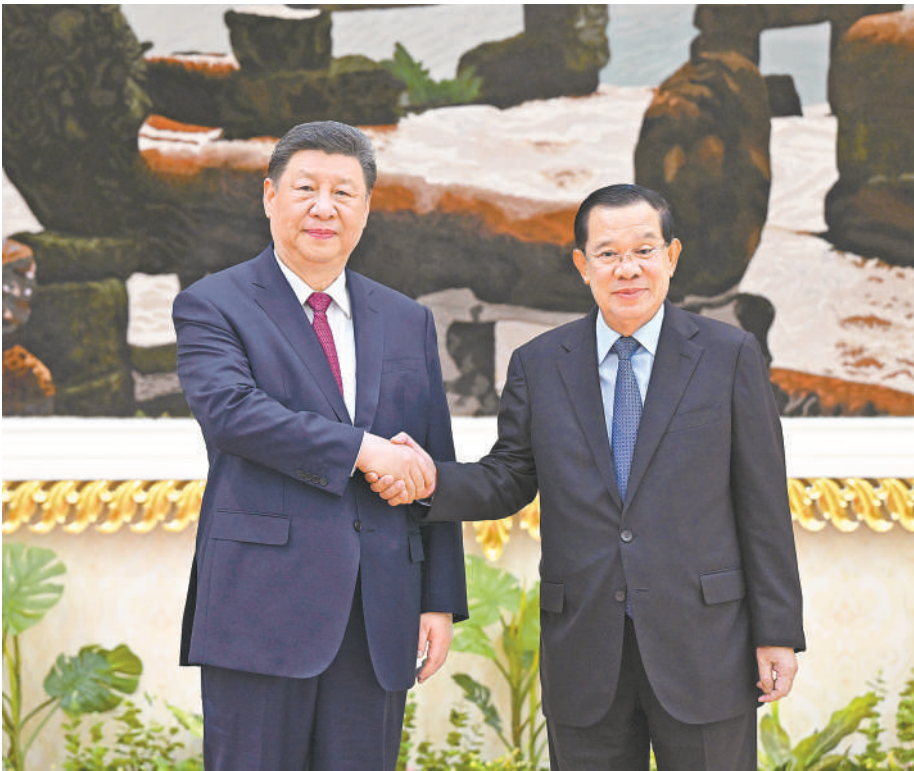
4月17日下午,国家主席习近平同柬埔寨人民党主席、参议院主席洪森在金边和平大厦举行会见。

新华社金边4月17日电 4月17日下午,柬埔寨国王西哈莫尼同中国国家主席习近平在金边王宫举行会见。 习近平乘车抵达时,西哈莫尼在下车处热情迎接。礼兵分列红毯两侧。 习近平指出,很高兴在西哈莫尼国王登基20周年和柬厉新年之际应邀访问美丽的柬埔寨,谨向柬埔寨人民致以新年祝福。柬埔寨国家建设事业蒸蒸日上,相信在西哈莫尼国王庇佑下,勤劳智慧的柬埔寨人民一定能把国家建设得更加繁荣富强。 习近平指出,中柬友好跨越千年,两国人民始终双向奔赴、相互成就。无论国际风云如何变化,中柬两国坚守信义、守望相助,在涉及彼此核心利益和重大关切问题上始终坚定相互支持,树立了大小国家平等相待、真诚