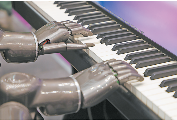
4月24日,人形机器人展示弹钢琴的技能。4月24日,首届机器人全产业链峰会(FAIR plus 2025)在深圳会展中心启幕,吸引约180家来自全国各地的机器人产业链上企业参加。此次活动为期3天,由深圳市机器人协会主办。