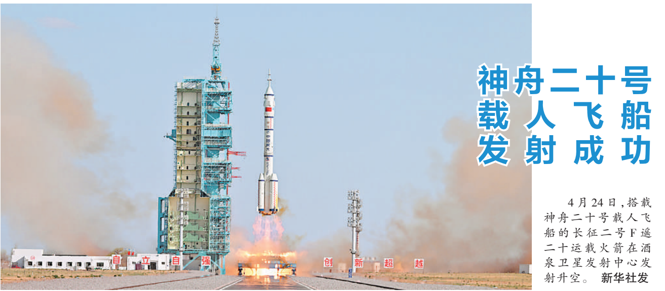
4月24日，搭载神舟二十号载人飞船的长征二号F遥二十运载火箭在酒泉卫星发射中心发射升空。