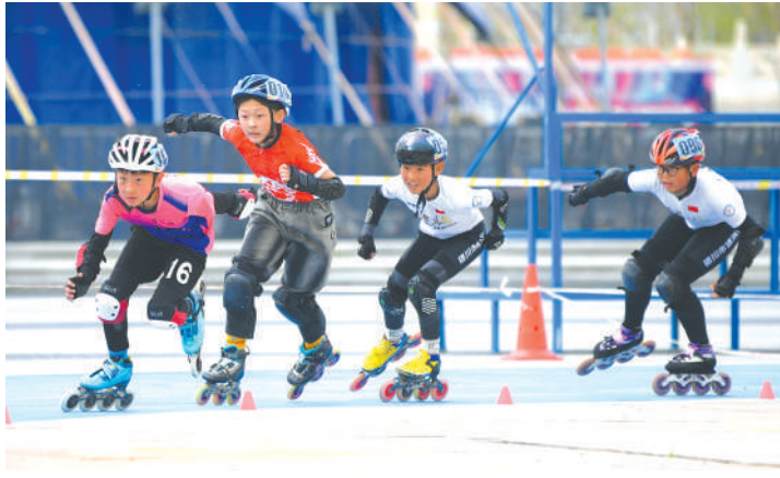
2025年银川市青少年轮滑锦标赛预选赛(金凤站)比赛现场。