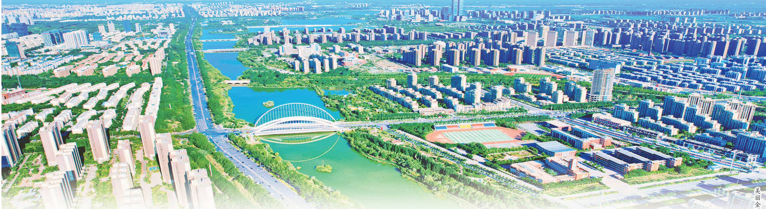
美丽金凤,创业热土。

厚植沃土,方能萃就精华。近日,银川市金凤区举行2025年全方位提升营商环境暨楼宇招商推介大会,聚焦“营商环境跃升、城市机会赋能、楼宇经济强基”三大核心要素,深度解读“金凤效率”改革内涵,重磅推出“金凤服务卡”,权威发布招商引资惠企政策暨城市机会清单,同步印发2025年促进会展、演艺、赛事、首发经济高质量发展的一揽子工作方案,以坚实政策后盾为经济高质量发展保驾护航。