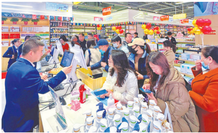
中欧班列进口商品(保税)店吸引众多消费者。