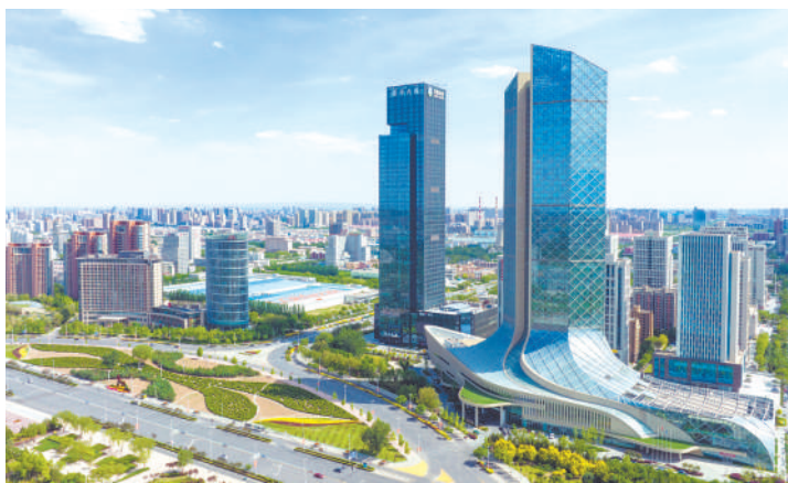
楼宇经济犹如“立体产业园”。

星光不问赶路人,时光不负实干者。盛会恰似一封满载机遇与希望的邀请函,亦如金凤区深化改革、释放机遇、共谋发展的庄严承诺书。金凤区创新开拓“楼宇聚链、业态共生”模式,加速产业链、创新链、人才链深度耦合,探索以空间重构为牵引,推动产业升级的高质量发展新路径,为区域经济腾飞注入源源不断的动力。