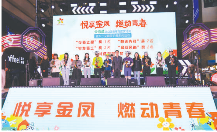
金凤区社区文化周暨“五一”文旅促消费系列活动启动。