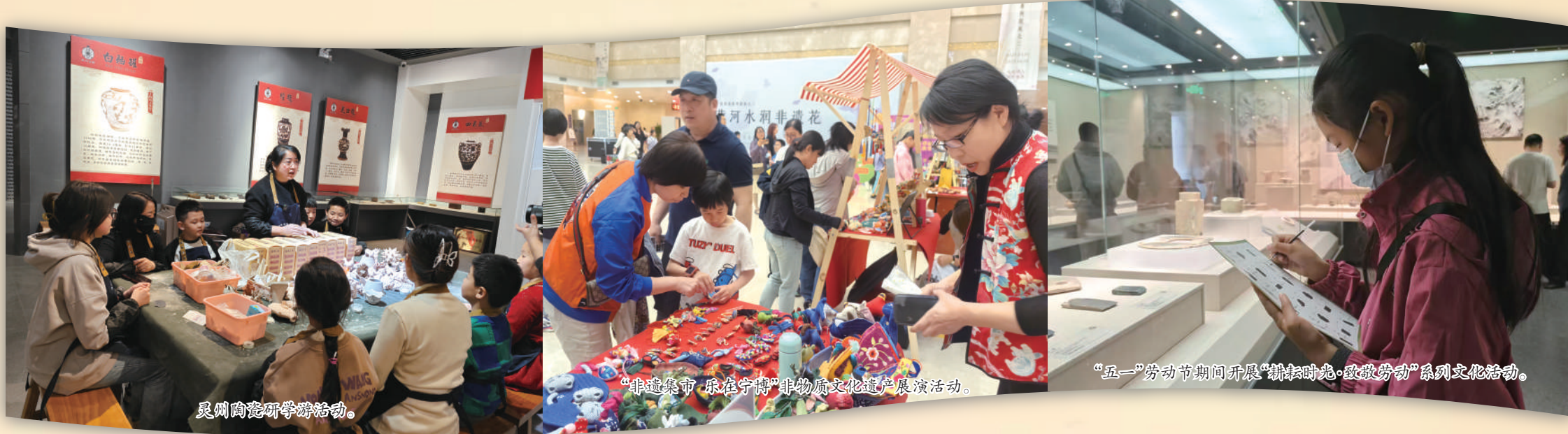
灵州陶器研学游活动。

博物馆是保护和传承人类文明的重要殿堂,是连接过去、现在和未来的桥梁,在促进世界文明交流互鉴方面具有特殊作用。近年来,我区各级各类博物馆准确把握和认真落实新时代文物工作方针,坚持保护第一、加强管理、挖掘价值、有效利用、让文物活起来,坚持以活化利用为重点、重大项目为牵引、机制创新为动力、融合发展为突破,推动中华优秀传统文化创造性转化、创新性发展,焕发深藏于历史深处的文化遗产活力,探索出活化利用的高质量发展路径,为担负起新的文化使命,努力建设中华民族现代文明贡献宁夏文博力量。