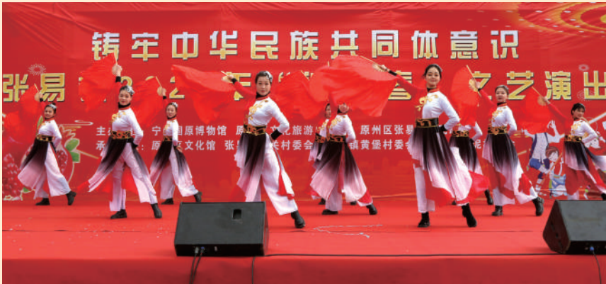
2025年1月17日,“铸牢中华民族共同体意识——张易镇2025年‘迎新春’文艺演出”活动在固原市原州区张易镇关村成功举办。

团体意识贯穿于博物馆宣传教育全过程,积极打造主题鲜明、内涵丰富、意蕴厚重、接受度高的中华文化符号和中华民族形象,以喜闻乐见的形式,努力贴近公众需求,融入学校教育,创新开展“博物馆里过大年”“博物馆里读中国”等系列展览社教活动,促进博物馆从收藏文化“殿堂”走向教育“课堂”,着力讲好宁夏民族团结进步故事、历史文化故事和发展成就故事,持续释放博物馆公共文化力量。助力产业发展升级,充分发挥“文物+”杠杆效应,推出“博物馆之夜”“红色线路游”“文物研学游”等文化旅游融合项目和红色旅游精品线路,开展“文博有话说”“在宁夏遇见博物馆”等系列融媒体活动,开发博物馆文创产品近千种,举办文创大赛、文创产品联展,近3年,接待观众人次年均增长35.4%,2024年全年博物馆接待观众人次752.2万,博物馆已成为推动文化旅游产业发展、增加区域吸引力的重要引擎。