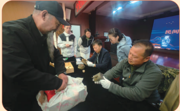
2025年4月18日,举办第一期民间收藏文物公益鉴定咨询活动。