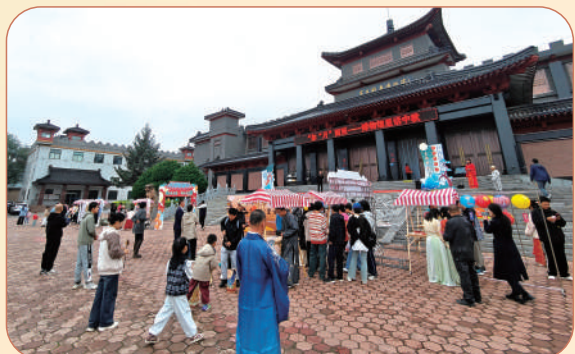
2024年9月16日,开展“如‘月’而至——博物馆里话中秋”中秋节系列活动。

出10条博物馆主题研学线路,4个博物馆项目入选全国文化遗产旅游“百强案例”,1条线路入选“五十强线路”,举办“午夜守护国宝计划”——银川·博物馆奇妙夜等研学活动,5家博物馆入选全国中小学生研学实践教育基地。“羊气羊”盲盒、宁夏文创地图、“漠古驼”骆驼玩偶等文创产品火“出圈”,宁夏博物馆暑期文创产品销售额达138万元,同比增长30%以上,入选第二届全国文博百强文创产品单位。