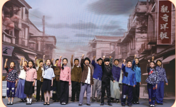
2024年“5·18”国际博物馆日活动。