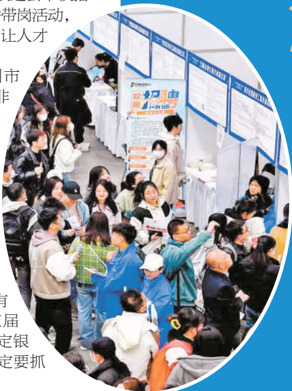
“十万大学生留银川专项行动”之“筑巢引凤”活动暨2024年春季高校毕业生双选会。