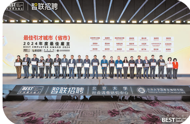
银川市获评“2024年度最佳引才城市”。

人才是第一资源，是驱动发展的核心要素。银川市正以开放之姿、求贤之心，广纳天下英才，谱写发展新篇。