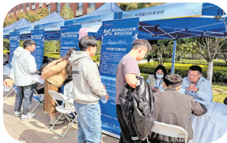
银川市开展“组团式”赴外引才活动。