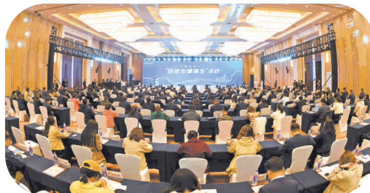
宁夏籍优秀人才“回故乡建家乡”活动现场。