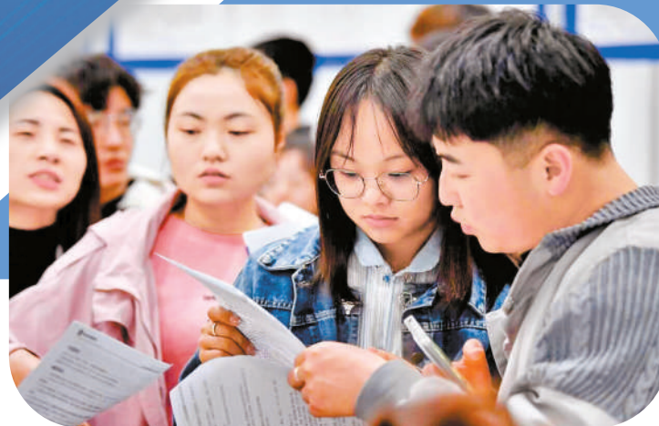
银川市举办人岗双选活动。