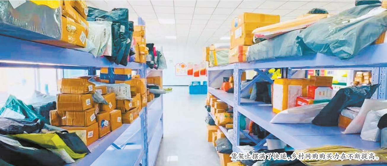
货架上摆满了快递,乡村网购购买力在不断提高。