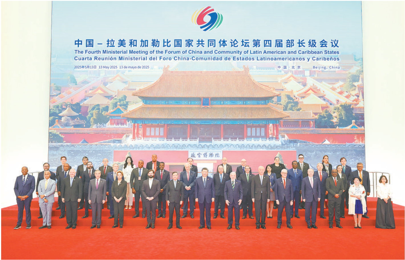
5月13日上午,国家主席习近平在北京国家会议中心出席中国-拉美和加勒比国家共同体论坛第四届部长级会议开幕式并发表主旨讲话。这是习近平同与会嘉宾集体合影。