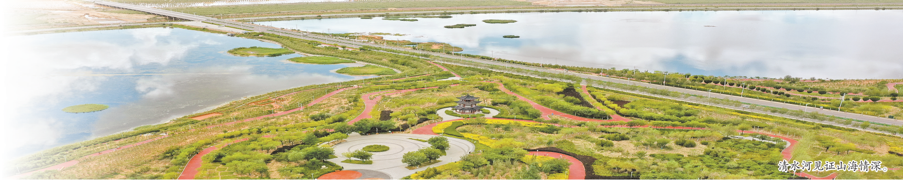
清水河见证山海情深。