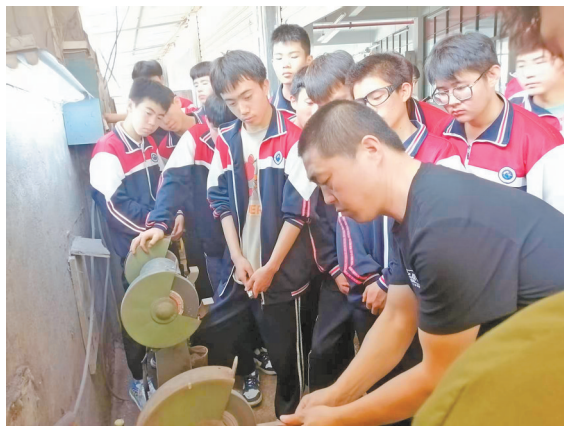
同心学子赴涠洲湾职业技术学院学习交流。