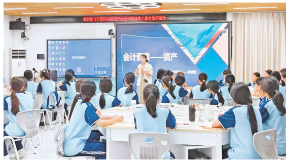
同心县、莆田市的职业技术学校开展线上联合教研活动。