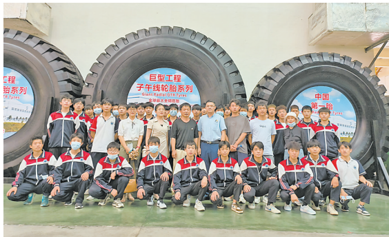
“涠职同心班”师生到轮胎生产企业参观。